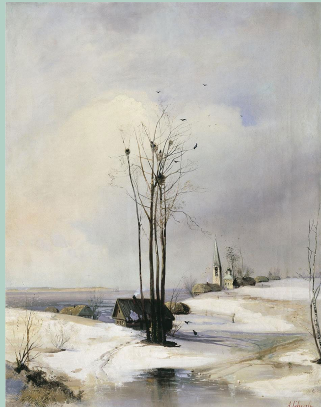
Алексей Саврасова "Оттепель"

Судьба: Полотно Саврасова испорчено, картина Айвазовского не обнаружена