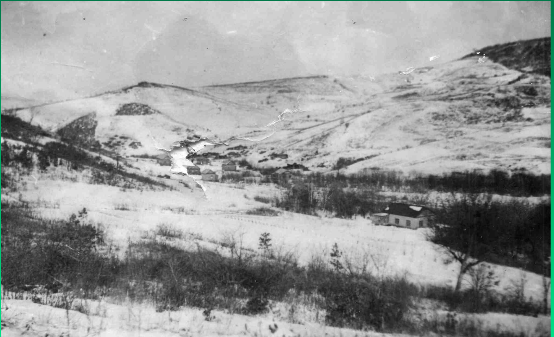
В 1936 г. сотрудники ГТС переехали на участок «Кривой ключ». Так в это время он выглядел