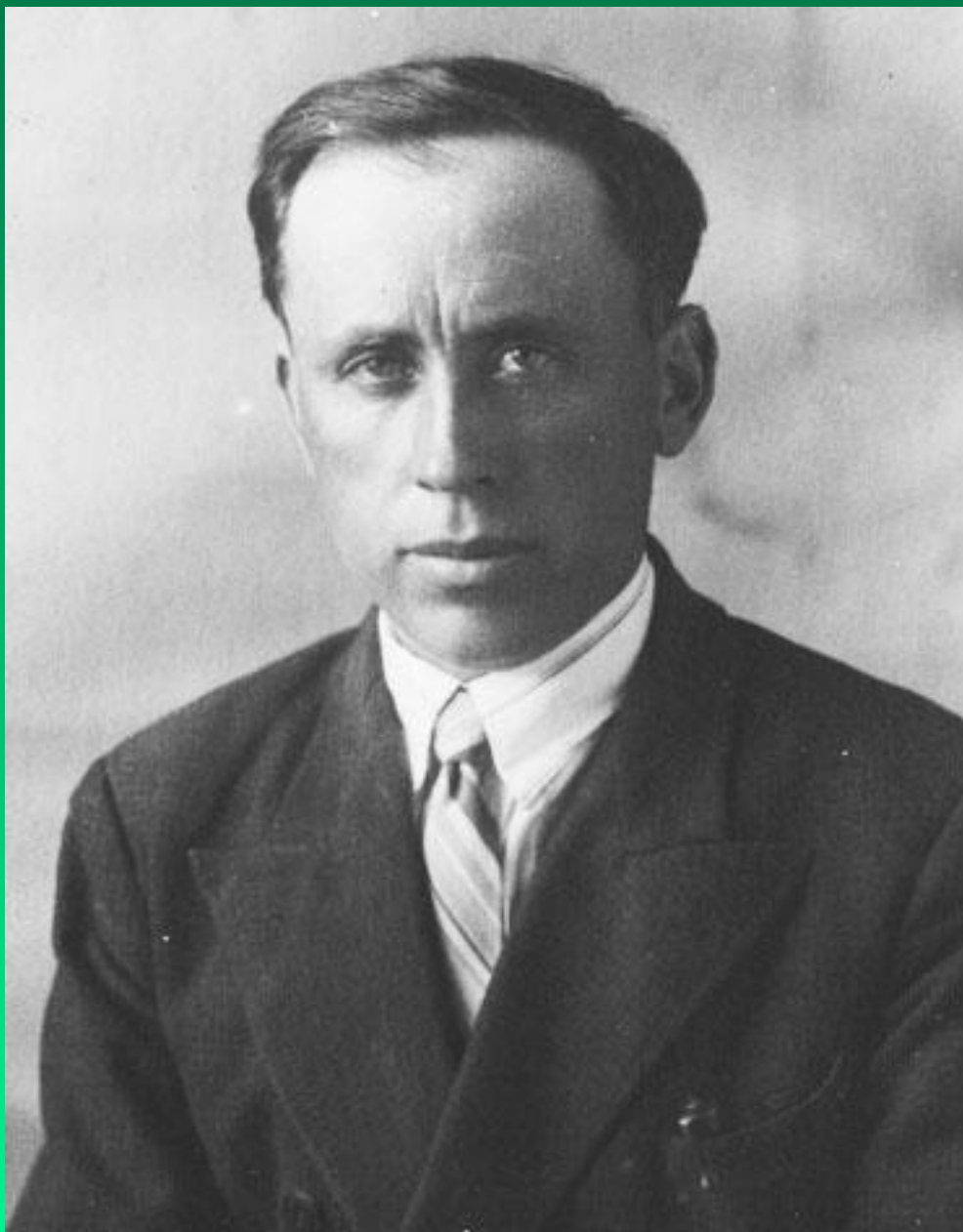
Известный дальневосточный садовод, селекционер Н.Н. Тихонов. 1931 г.