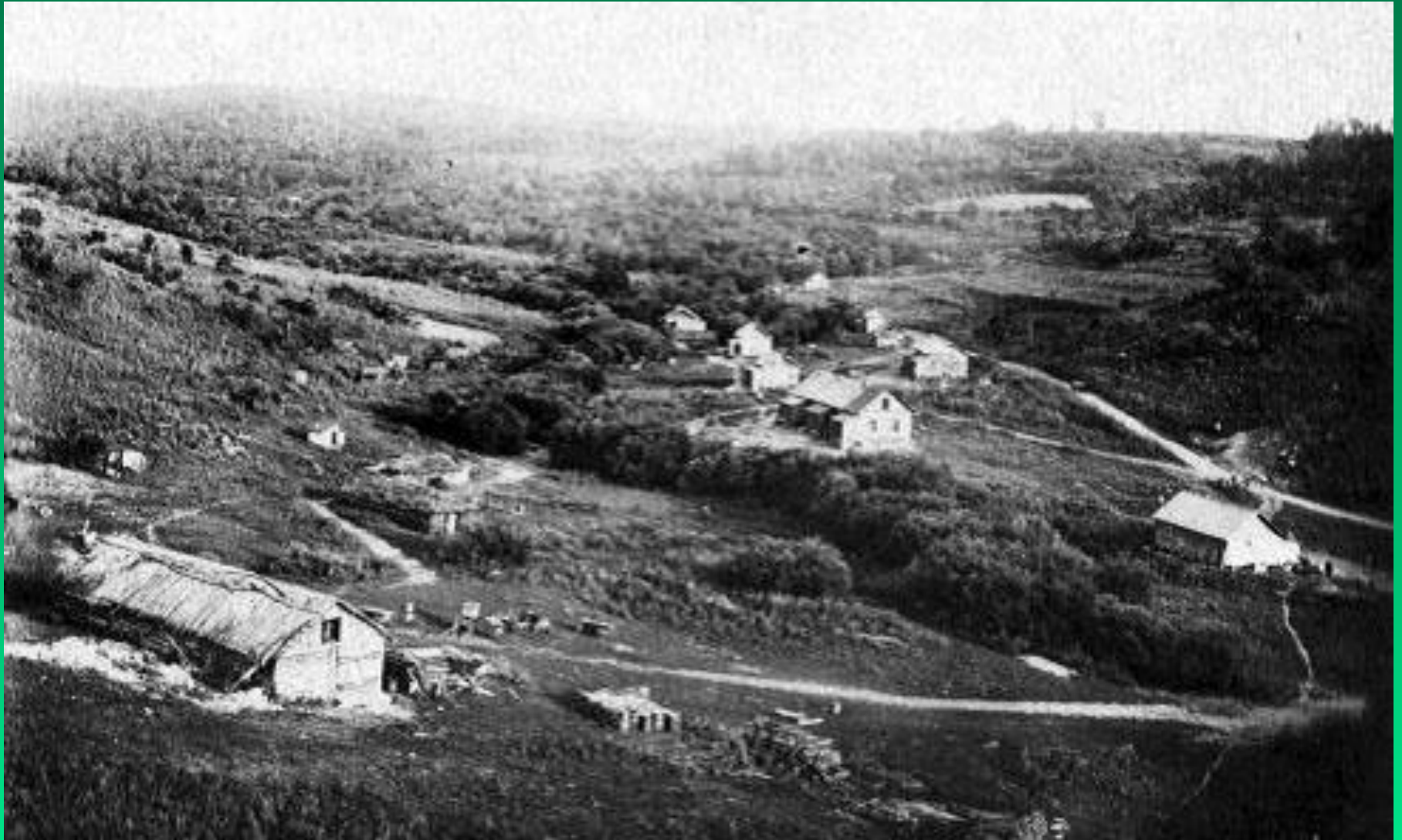
Так выглядел участок «Кривой ключ», где впоследствии обосновалась Горнотаежная станция, в 1933 г.