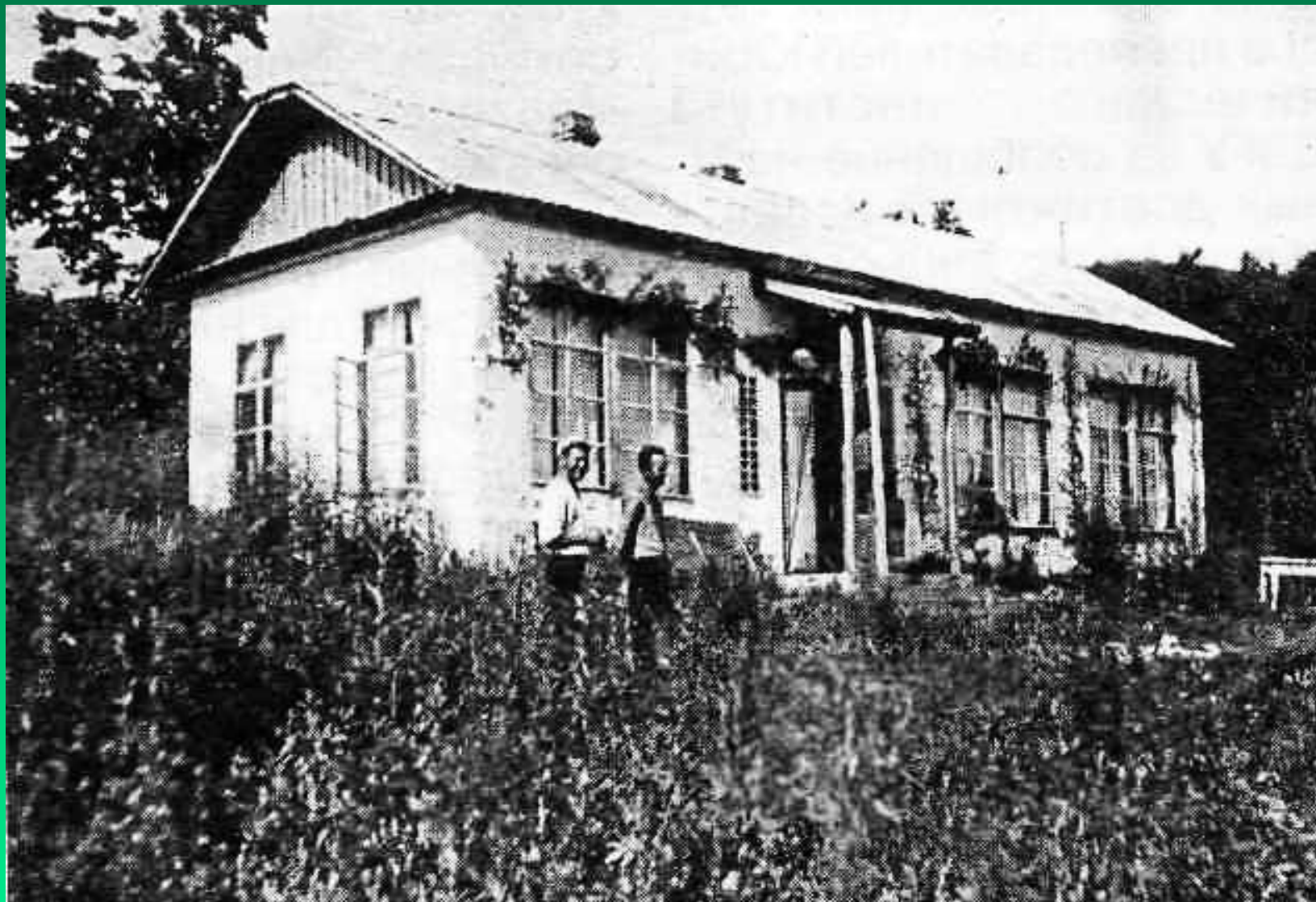
Ботанический кабинет на Кривом ключе. 1930-е гг.