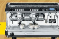
La Cimbali M39 A2 Цена 2000 EUR