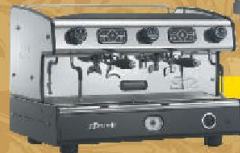
LaSpaziale S2 GAS Цена 900 EUR