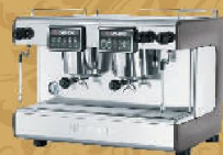
CASADIO DIECHI A2 New Цена 2200 EUR