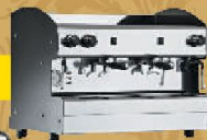
Cime QUADRA S2 New! Цена 1600 EUR