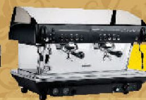
Faema e91 Цена 900 EUR