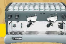
Rancilio EPOCA S2 Цена 800 EUR