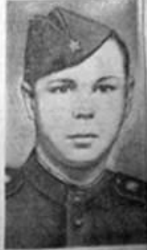
А. Ф. Кривошеин