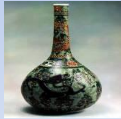
Сосуд с драконом, Китай, XVII-XVIII вв.