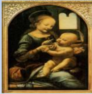
Мадонна с младенцем, Леонардо да Винчи, 1478 г.