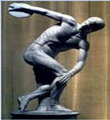
Дискобол, Греция, V-IV вв. до н.э.

Культурологический подход – это когда вся накопленная информация является достоянием мировой культуры.