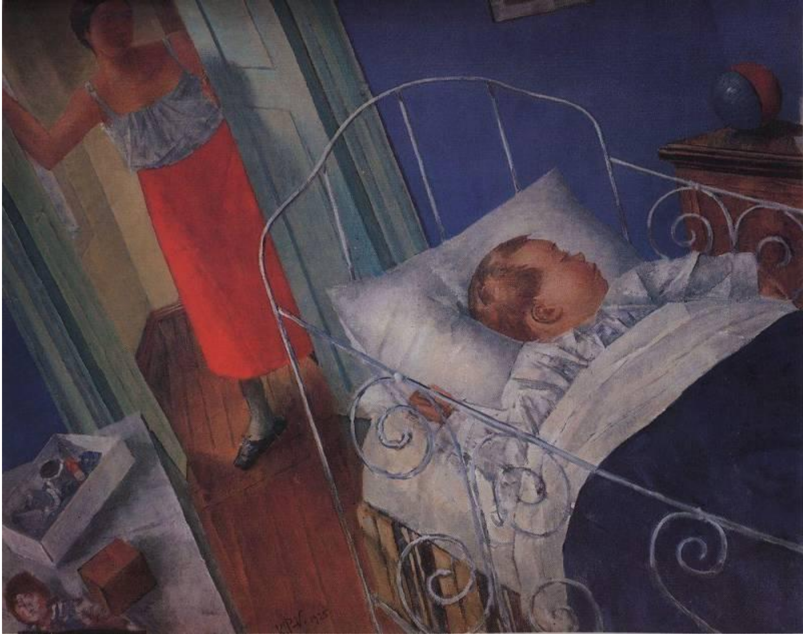
Кузьма Петров-Водкин (1878 -1939) «В детской» 1925