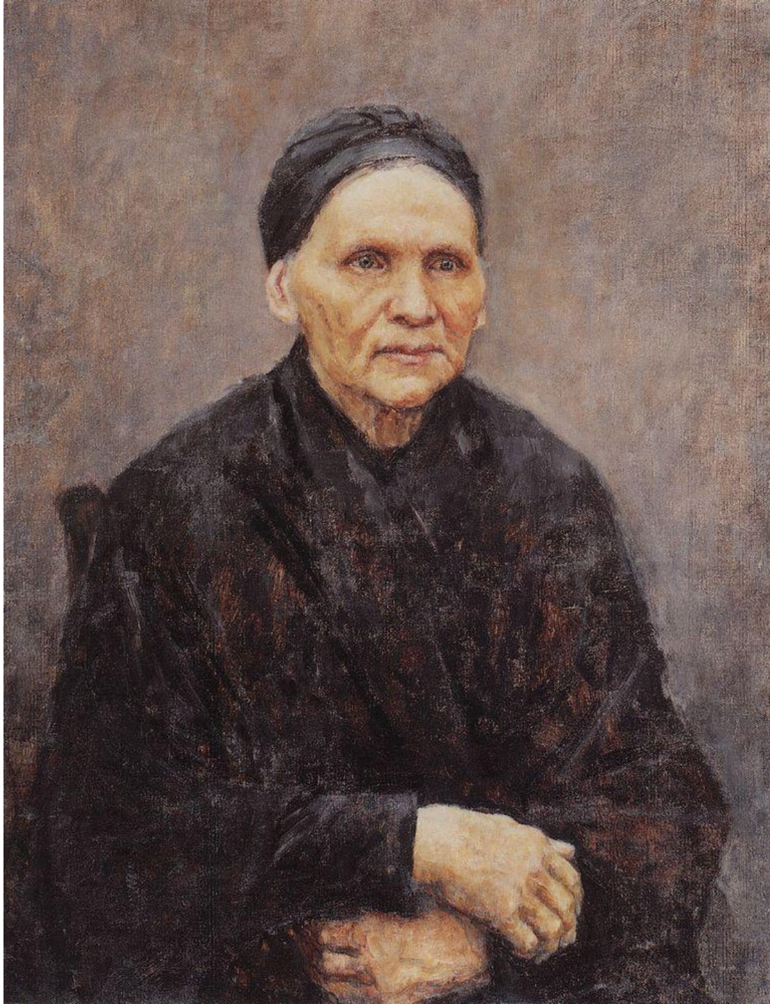
Василий Суриков (18. «Портрет матери художника» (П.Ф.Сурикова)