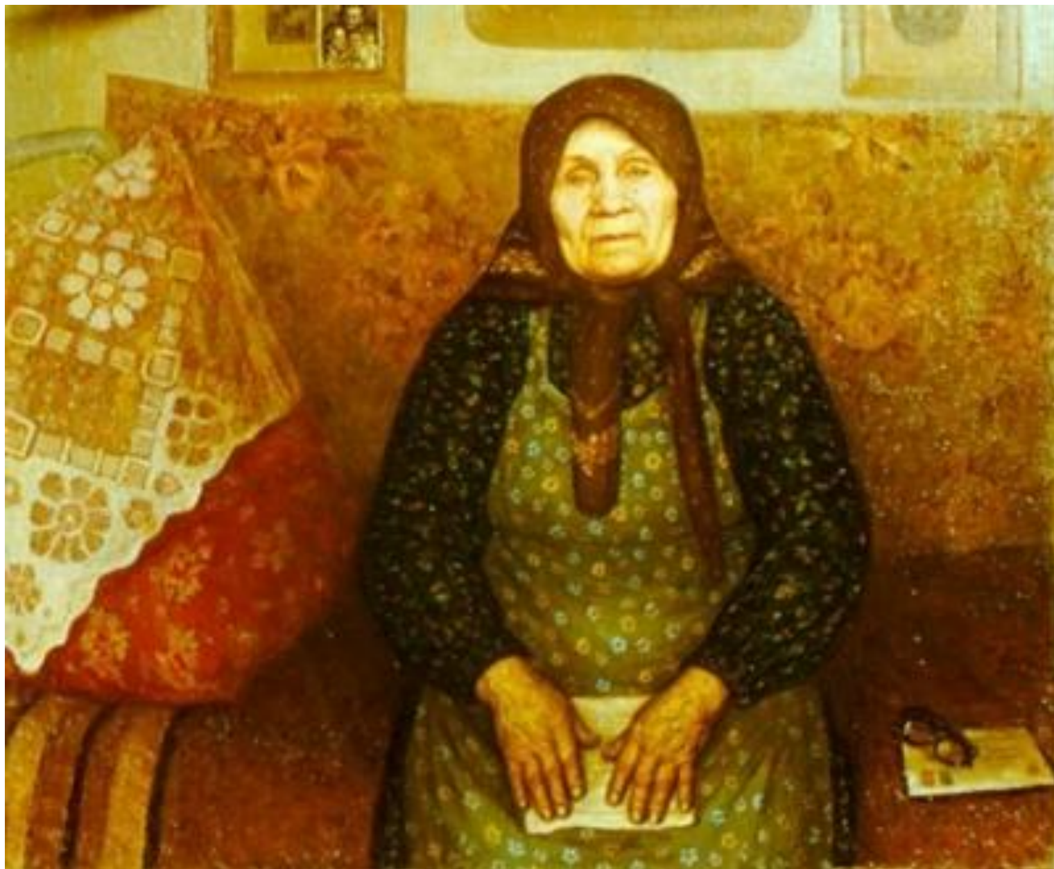
Константин Залозный (1929 – 1992) «Весточка»