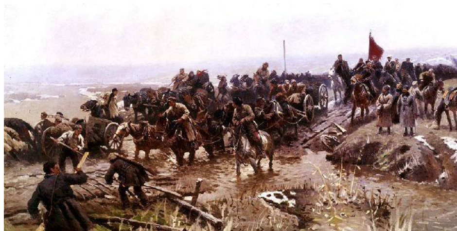
Гражданская война. 1919

На Восточном фронте период с мая 1918 до апреля 1919 был в основном успешным для белой армии Колчака. Перелом наступил летом 1919 года и осенью-зимой 1919-1920 годов колчаковцы отступили до Иркутска.