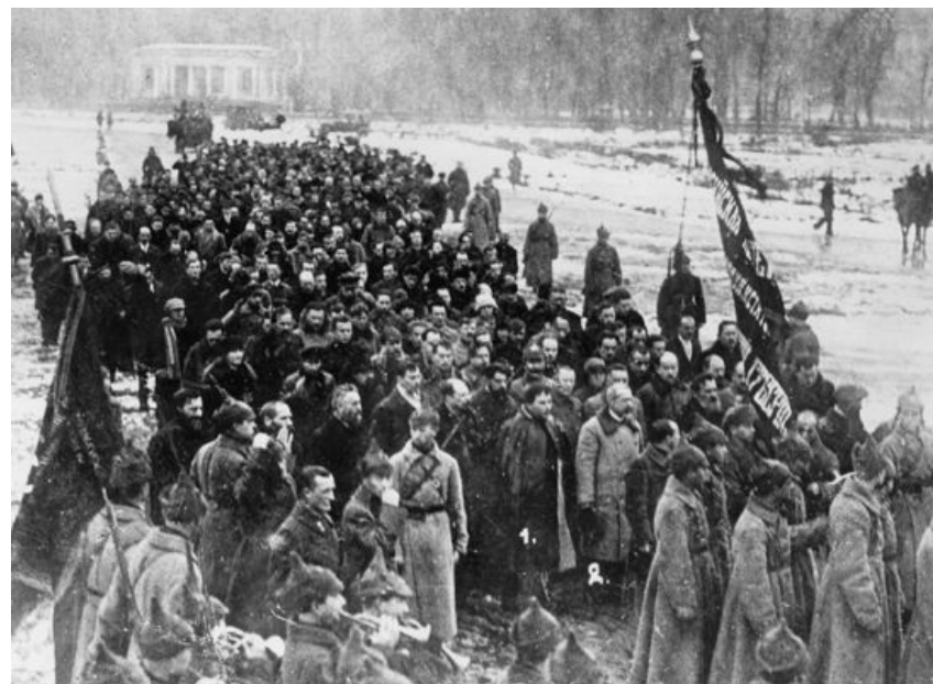
Гражданская война 1920

В дальнейшем, до ноября 1922 года красные воевали с различными повстанцами (в Кронштадте, с антоновцами в Тамбовской области), а также с бароном Унгерном на территории северной Монголии, к августу 1921 года и он потерпел поражение