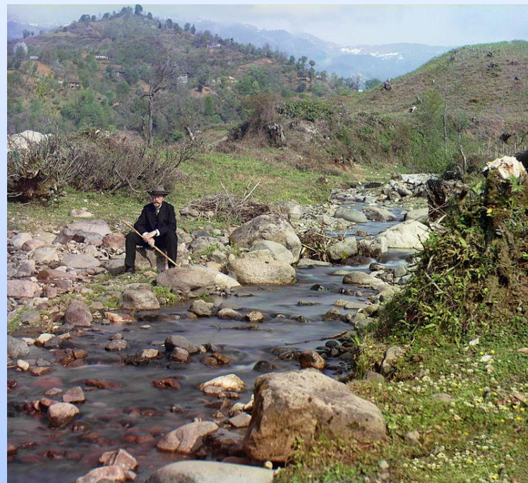
Сергей Михайлович Прокудин-Горский. Автопортрет. Ранняя цветная фотография (1912 год)

Цифровая фотография ведет историю с 1981 года. Информацию в виде аналогового сигнала записывали на диск, что позволило отказаться от фотопленки.