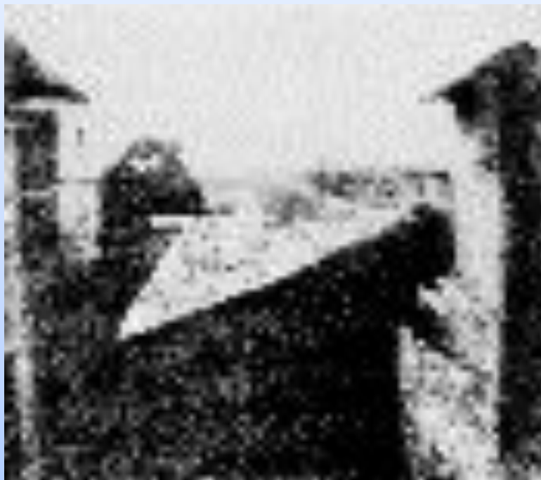
Первая фотография в мире, «Вид из окна», 1826