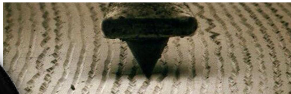
Дорожка под микроскопом