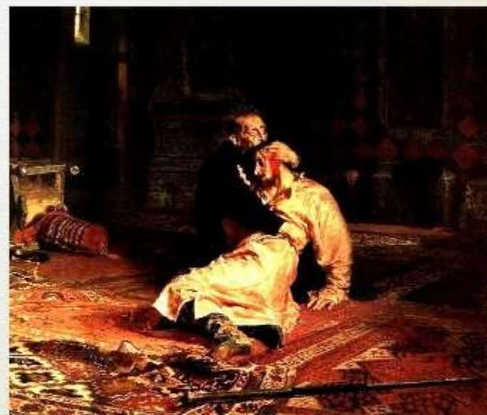
«Иван Грозный убивает своего сына» И. Репин