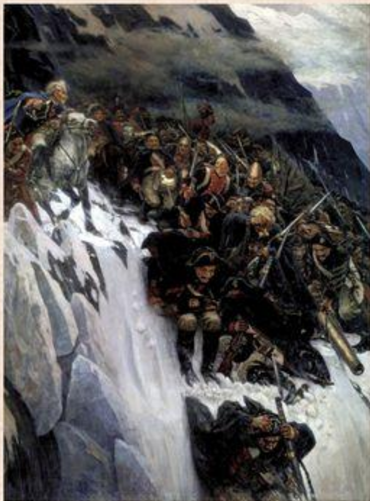
В.И.Суриков «Переход Суворова через Альпы»

Исторический жанр включает в себя произведения на темы большого общественного звучания, отражающие значительные для истории народа события