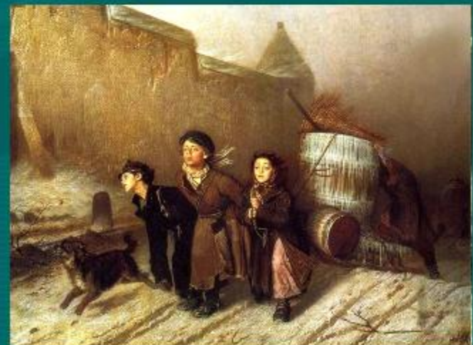
«Тройка» В. Перов.