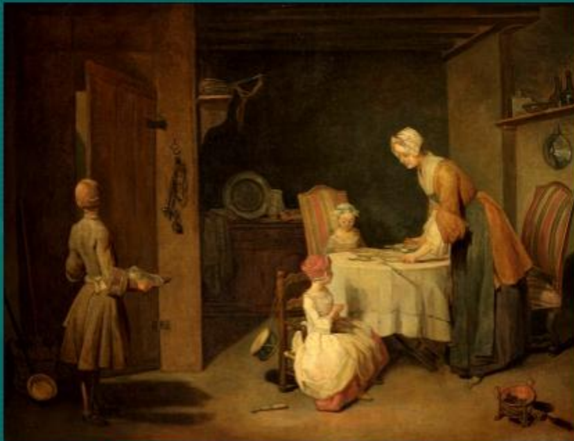
«Молитва перед обедом» Жан-Батист С.Шарден