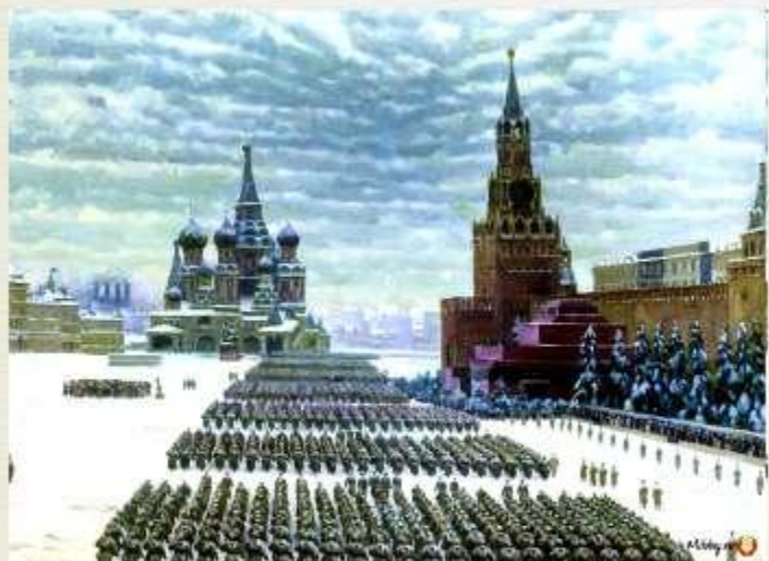
«Парад на Красной площади 7 ноября 1941года» К. Юон