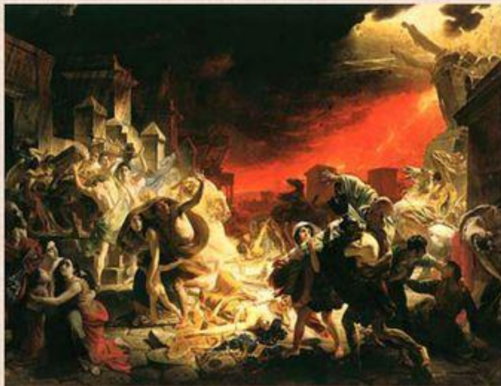
К.Брюллов «Последний день Помпеи»