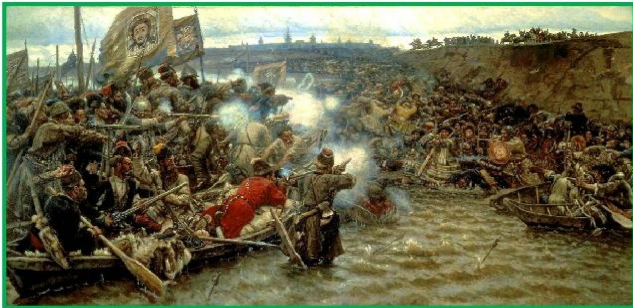
«Покорение Сибири Ермаком» В.Суриков