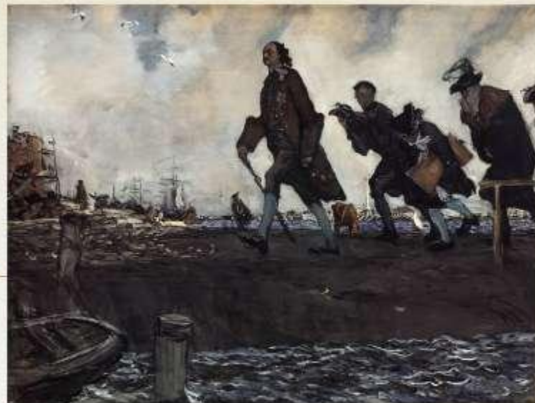
«Пётр первый" В. Серов