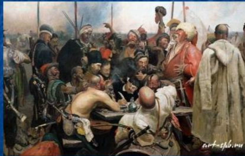
И.Репин «Запорожцы пишут письмо турецкому султану»