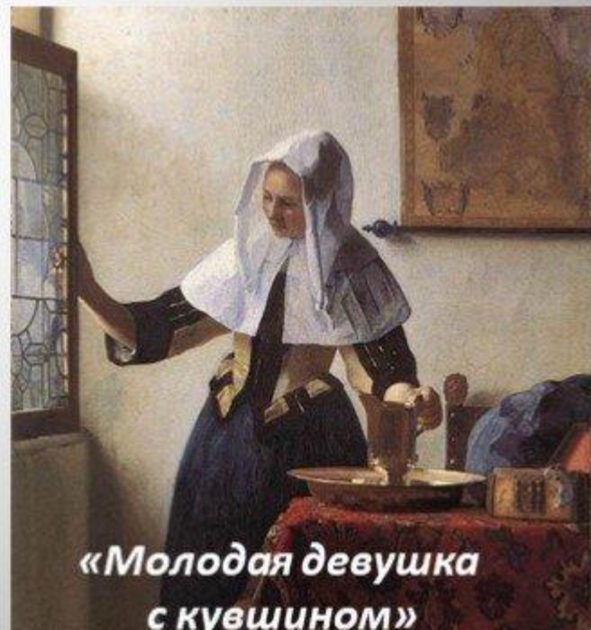
«Молодая девушка с кувшином»