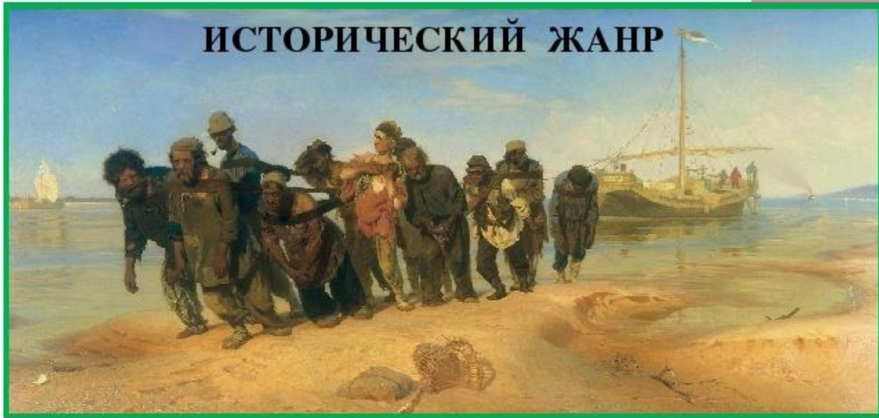
«Бурлаки на Волге» И.Репин