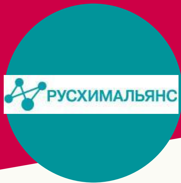
РусХимАльянс Заказчик ГПХк Усть-Луга