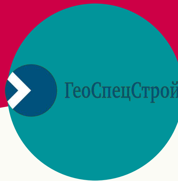
ГеоСпецСтрой Буровая компания