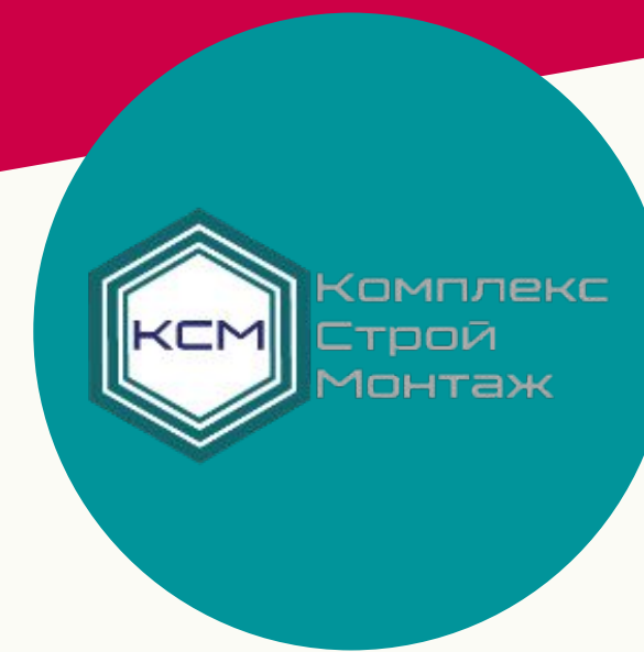
КСМ Подрядчик Газпрома и Русхимальянса