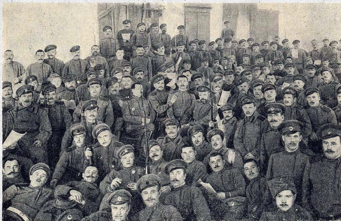
Въ дни революціи. Въ Государственной Думѣ.

27 января 1917 весь руководящий состав Центральной Рабочей Группы был арестован. Утром 27 февраля они были освобождены Революционно настроенными Солдатами.