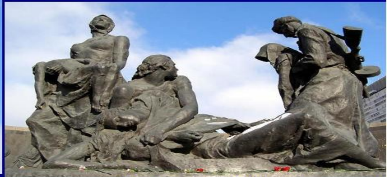
Скульптурная композиция "Блокада"