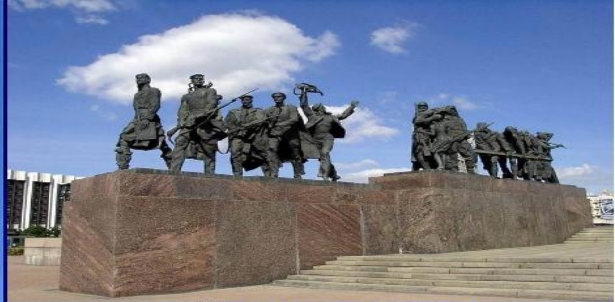
Мемориал героическим защитникам Ленинграда.