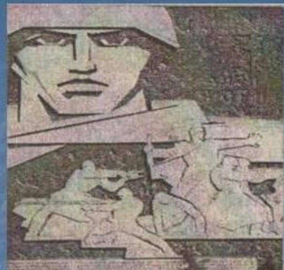
Рельеф на Доме лейтенанта Павлова. Волгоград