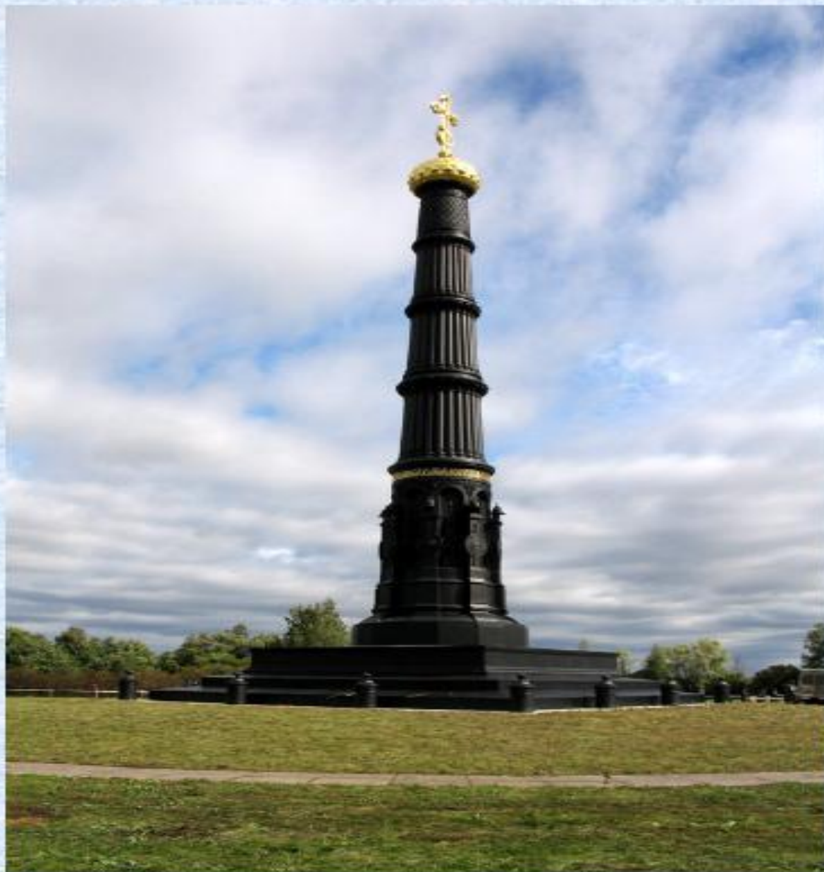
Куликовское поле. Памятник.