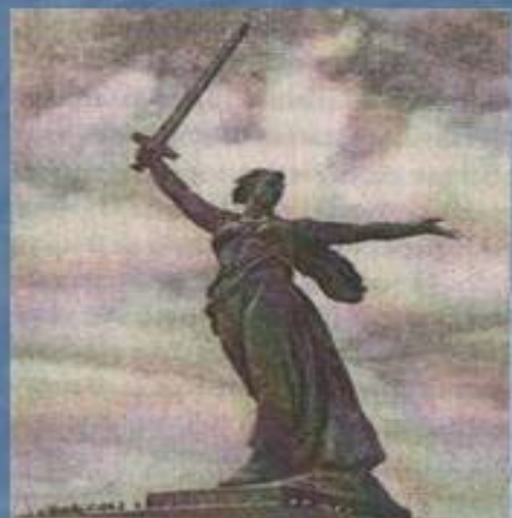
Мамеев курган. Памятник-ансамбль героям Сталинградской битвы. Главный монумент. Волгоград