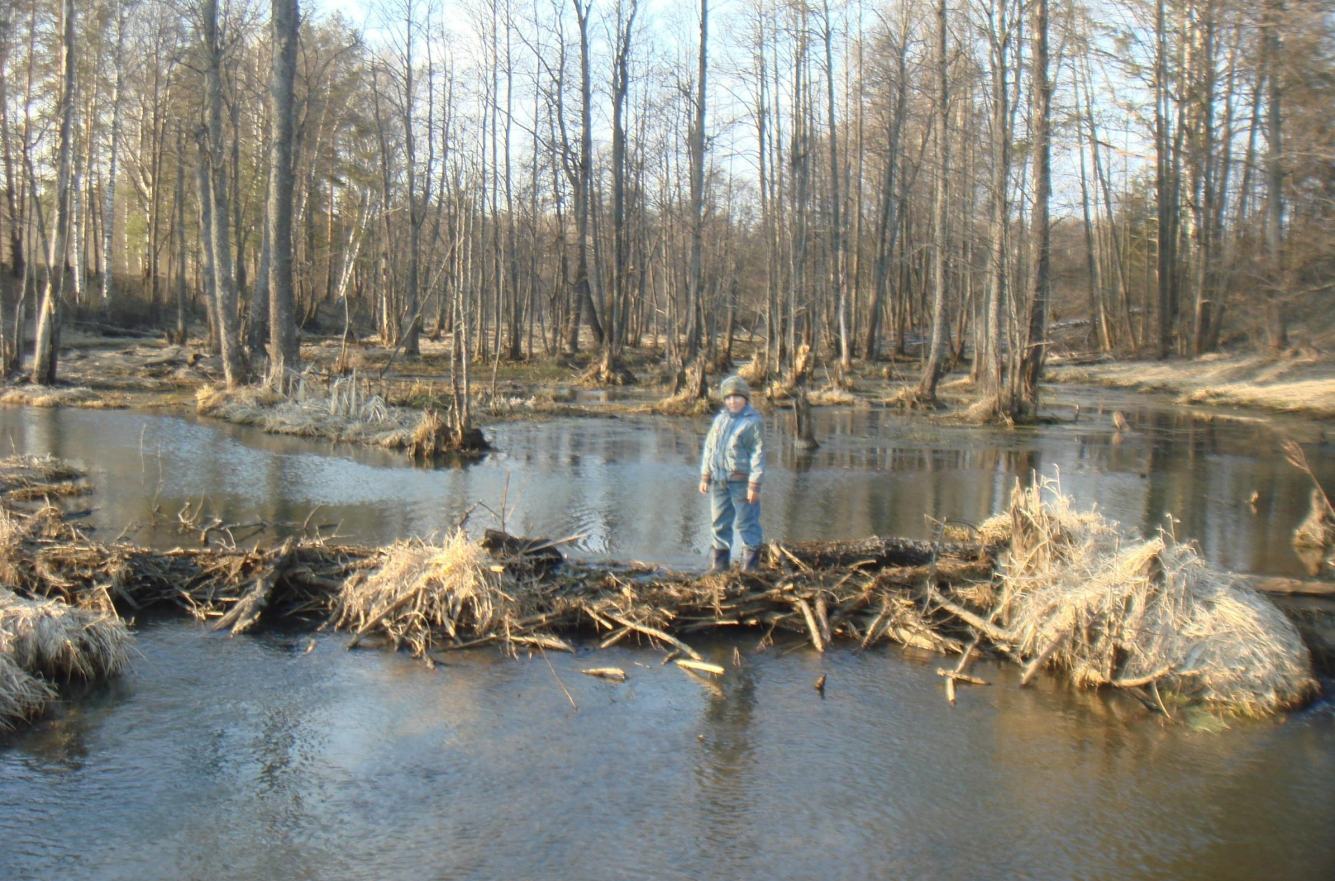
Бобровая плотина на реке Страдинке (Ивановская область, Ивановский район)