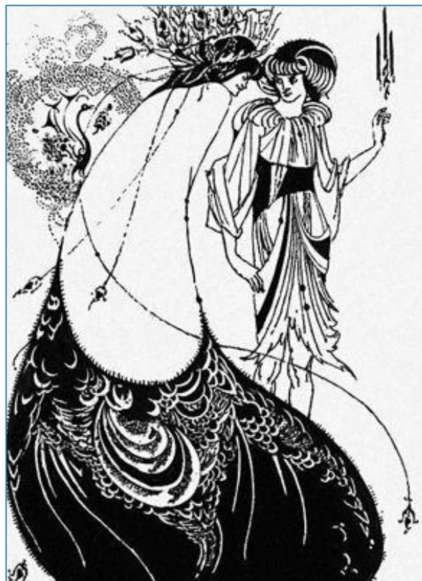
Обри Винстент Бёрдсли