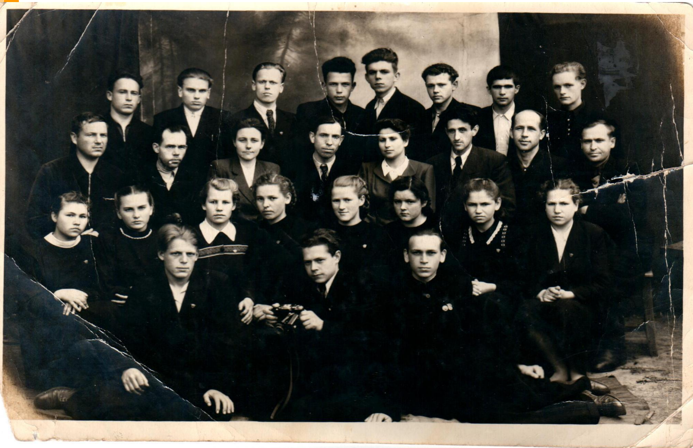
10 класс. Комсомольский отряд при Водоватовской школе.