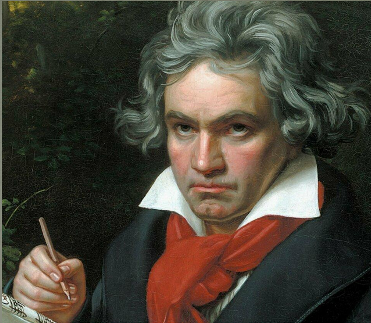
Людвига ван Бетховена (1770 -1827)