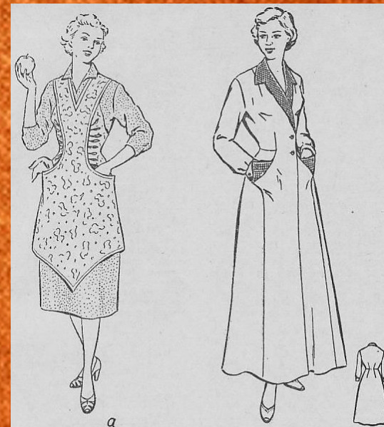
Рис. 303. Халат с фигурными карманами, переходящими в клапан