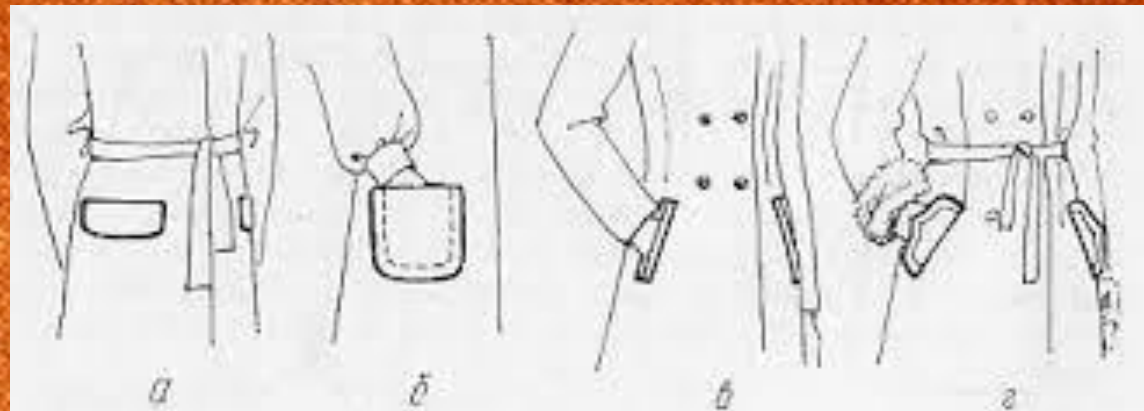
Рис. 14. Виды карманов:

а — прорезной с клапаном; б — накладной; в — прорезной в рамку; г — прорезной с фигурной листочкой