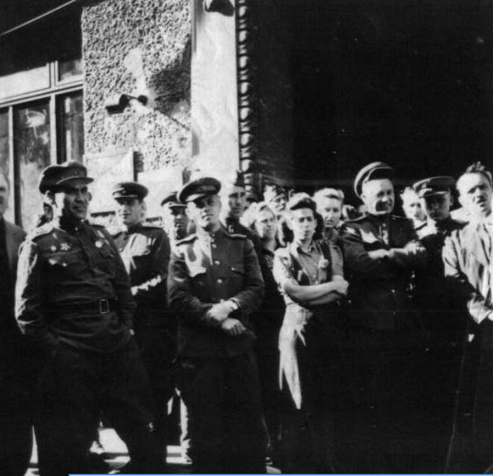
г. Вена в Австрии 1945г. 18 – я районная комендатура