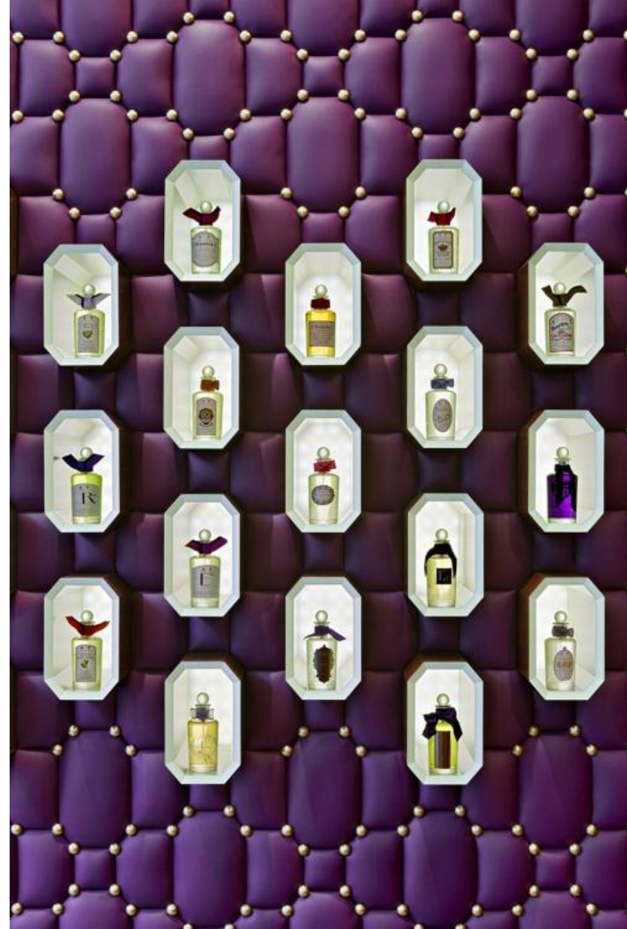
• Магазин косметики, парфюмерии