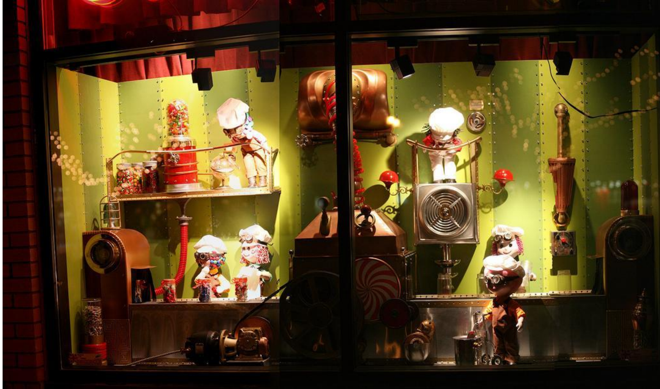
• Магазин игрушек