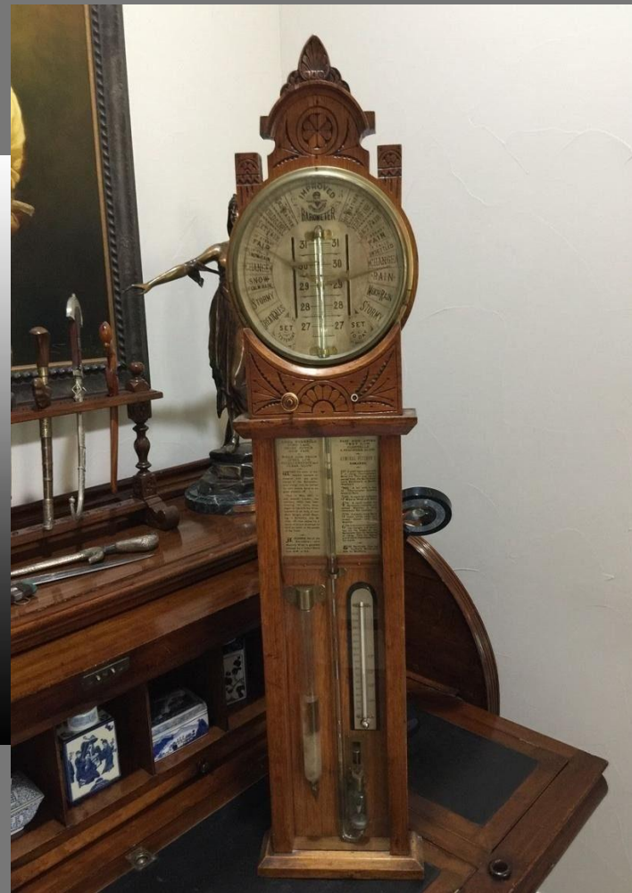
Вешалка для одежды, угловой столик и барометр. 19 век.