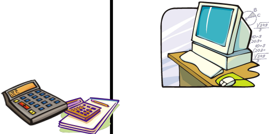
Калькуляторы – являются разновидностью вычислительных машин