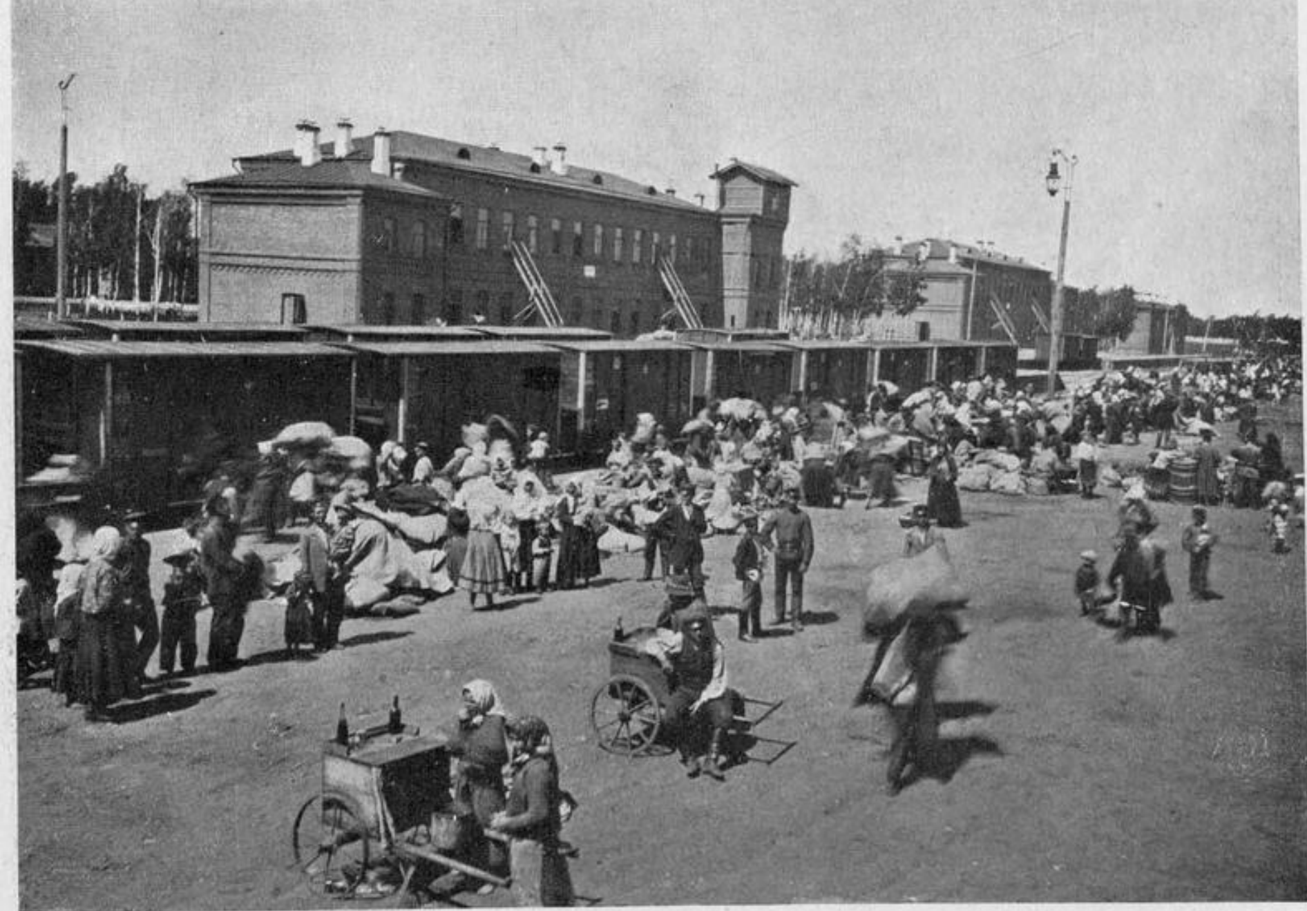
Переселенцы въ ожиданіи посадки. Рис. 37.