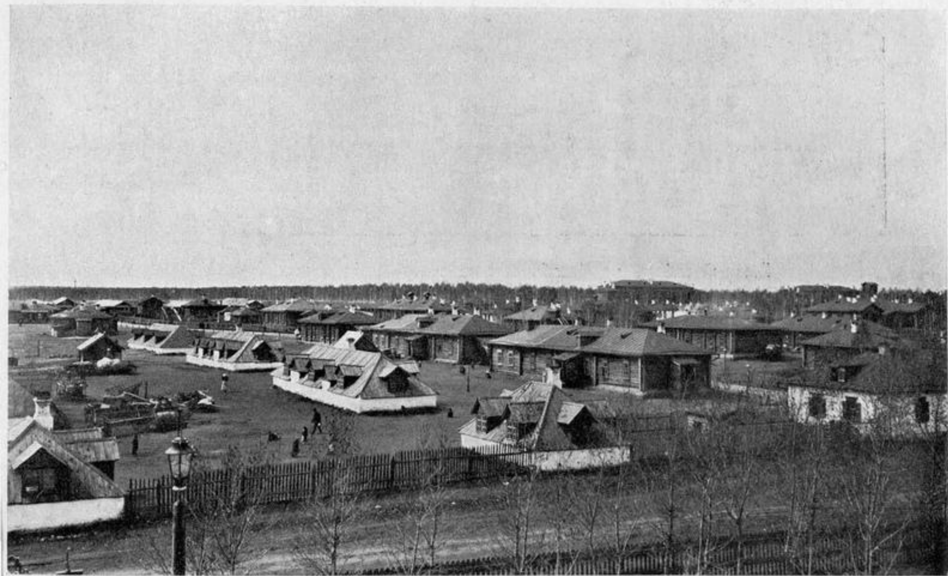
Общій видъ на Челябинскій переселенческій пунктъ въ 1906 году. Рис. 1.