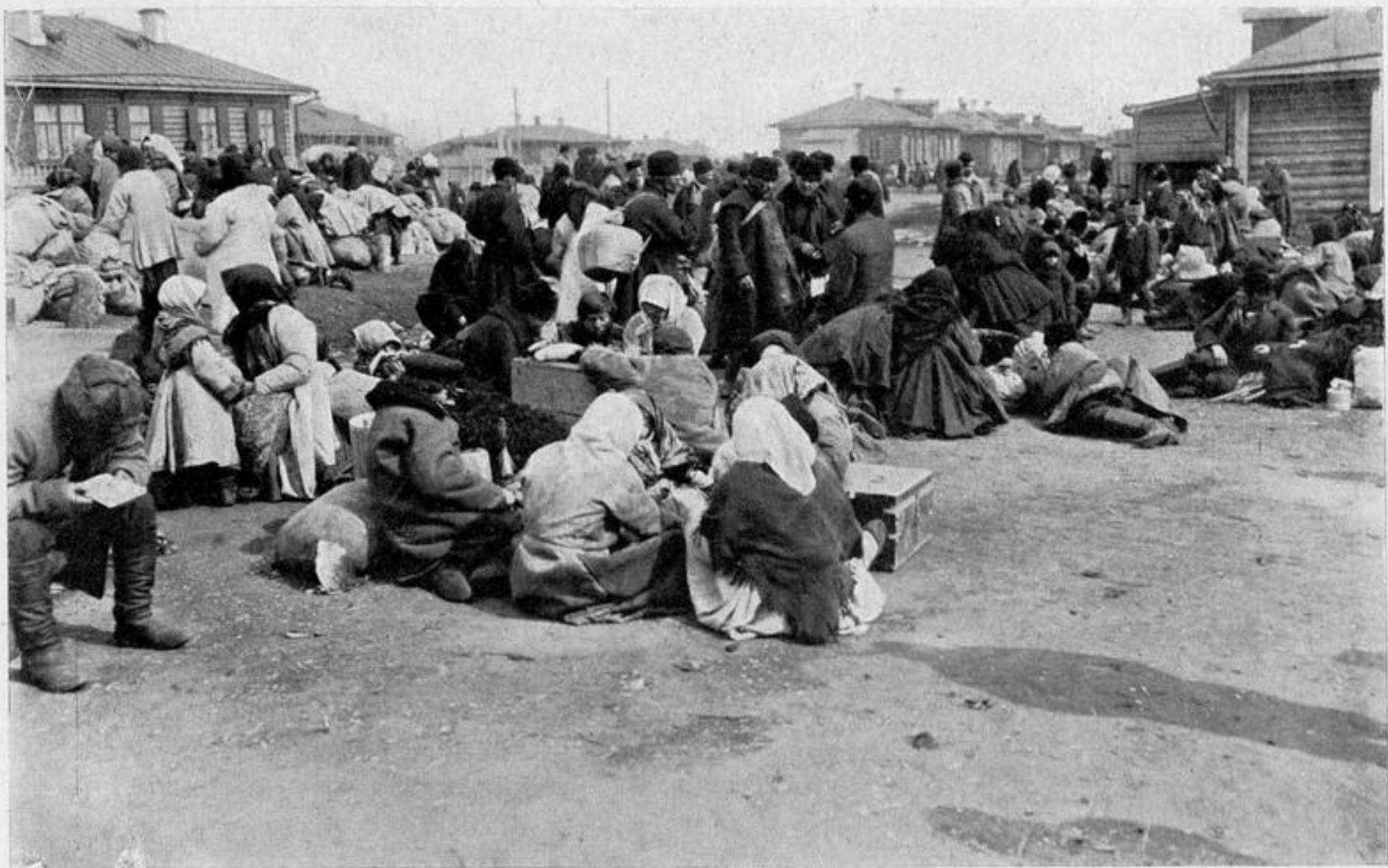
Переселенцы на пунктъ. Рис. 20.