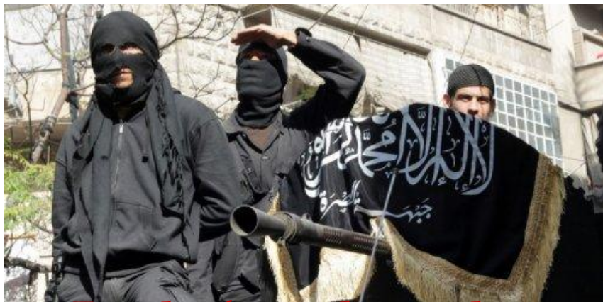
Талибан (от араб. «талибы» – студенты исламских религиозных школ)

Исламистское движение, зародившееся в Афганистане в 1994 году. Официально правили Афганистаном с 1996 по 2001 гг.