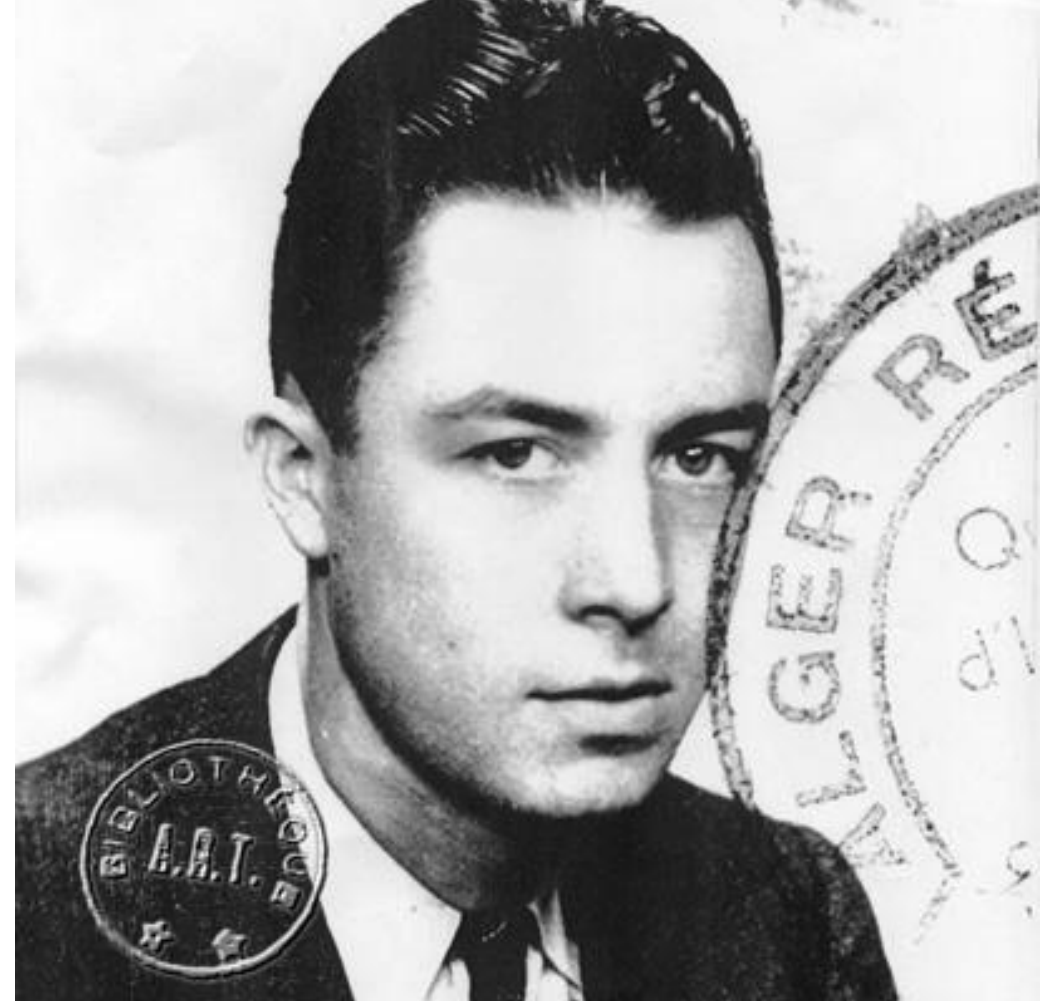
А. Камю в молодости