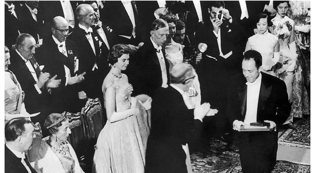
А. Камю во время Нобелевского банкета 10 декабря 1957 года