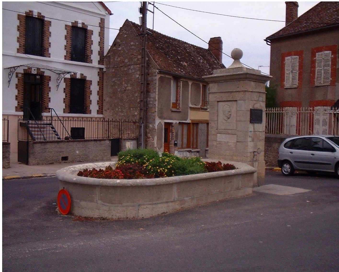
Памятник Камю в городе Вильблевен