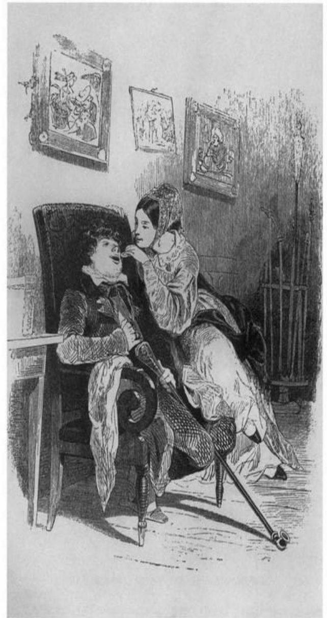
– Разинь, душенька, свой ротик, я тебе положу этот кусочек. Рисунок А. Агина к поэме Н. В. Гоголя «Мертвые души». 1892 г.