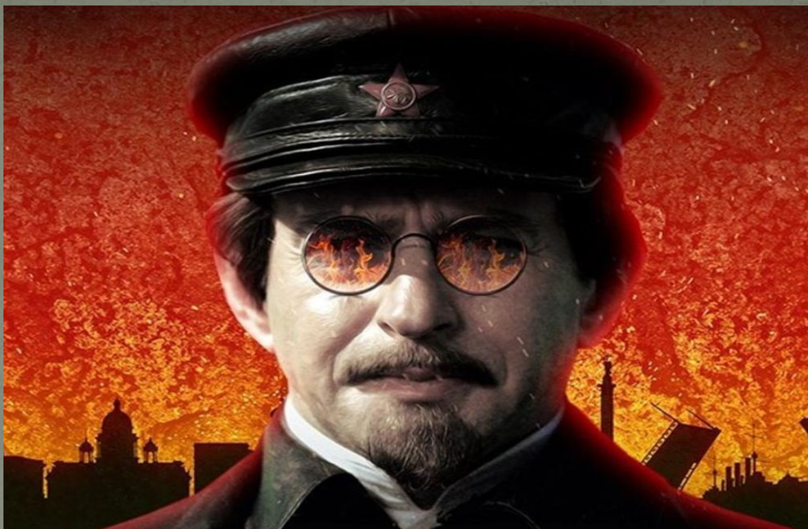
Лев Дави́дович Тро́цкий