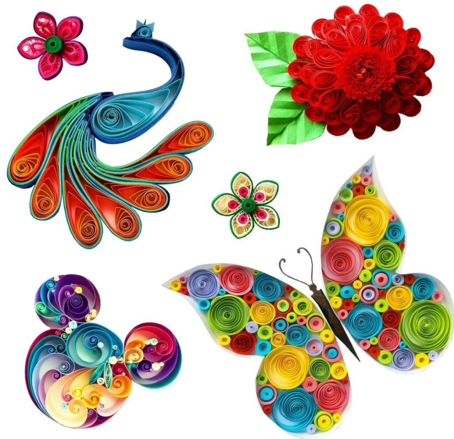
Поделки из бумажных лент