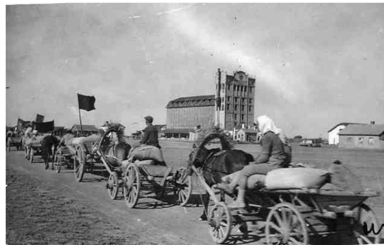
Фотография старого Саратова Новоузенский элеватор