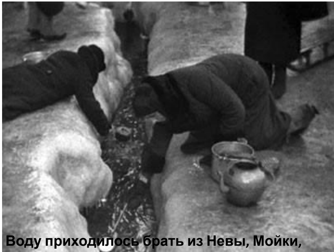
Воду приходилось брать из Невы, Мойки, Фонтанки.

Зима 1941-1942 годов была особенно трудной.