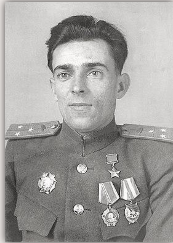
Зинченко С. Ф. (1919–1992)