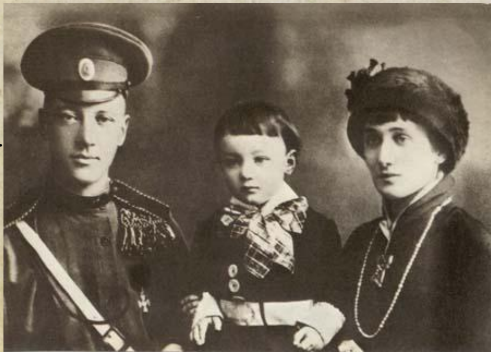
Н. С. Гумилев, Лев Гумилев, А. А. Ахматова. Царское Село. 1916

Наряду с громкой славой ей пришлось испытать немало личных трагедий: в 1921 г. был расстрелян ее муж Гумилев, весной 1924 г. вышло постановление ЦК ВКП (б), которым Ахматовой фактически запрещалось печататься. В 1930-е гг. репрессии обрушились едва ли не на всех ее друзей и единомышленников. Они коснулись и самых близких ей людей: вначале был арестован и сослан ее сын Лев Гумилев, затем ее второй муж искусствовед Николай Николаевич Пунин.