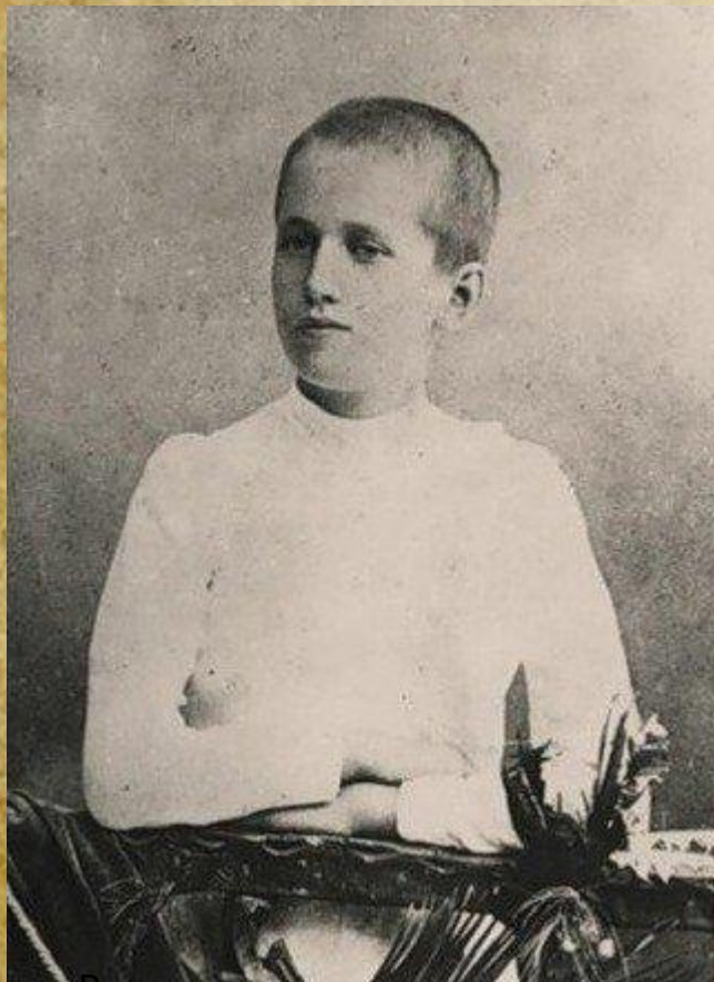
В старших классах гимназии

Ахматова училась в Царскосельской женской гимназии «сначала плохо, потом гораздо лучше, но всегда неохотно» . В 1905 году она была на домашнем обучении. Семья жила в Евпатории — мать Анны Ахматовой рассталась с мужем и уехала к южному побережью лечить обострившийся у детей туберкулез. В следующие годы девочка переехала к родственникам в Киеве — там она окончила Фундуклеевскую гимназию, а затем записалась на юридическое отделение Высших женских курсов.