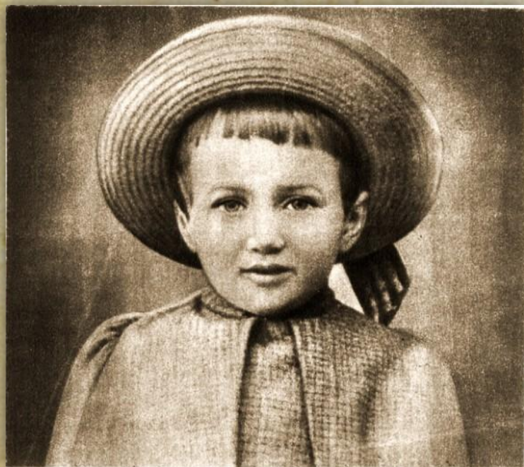
Ребенком в Царском Селе. 1894