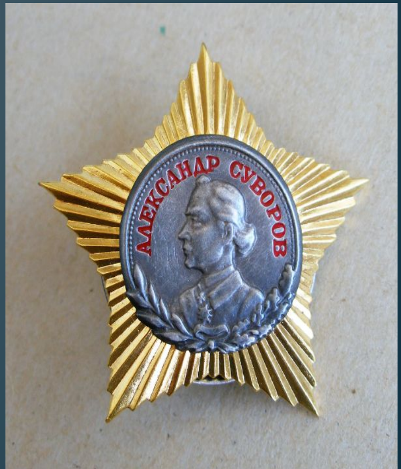
Краснознамённый орден Суворова