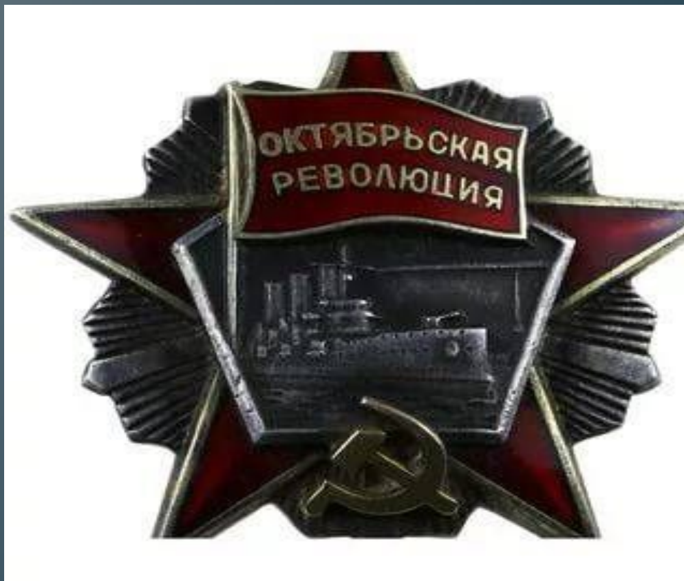
Орден Октябрьской революции