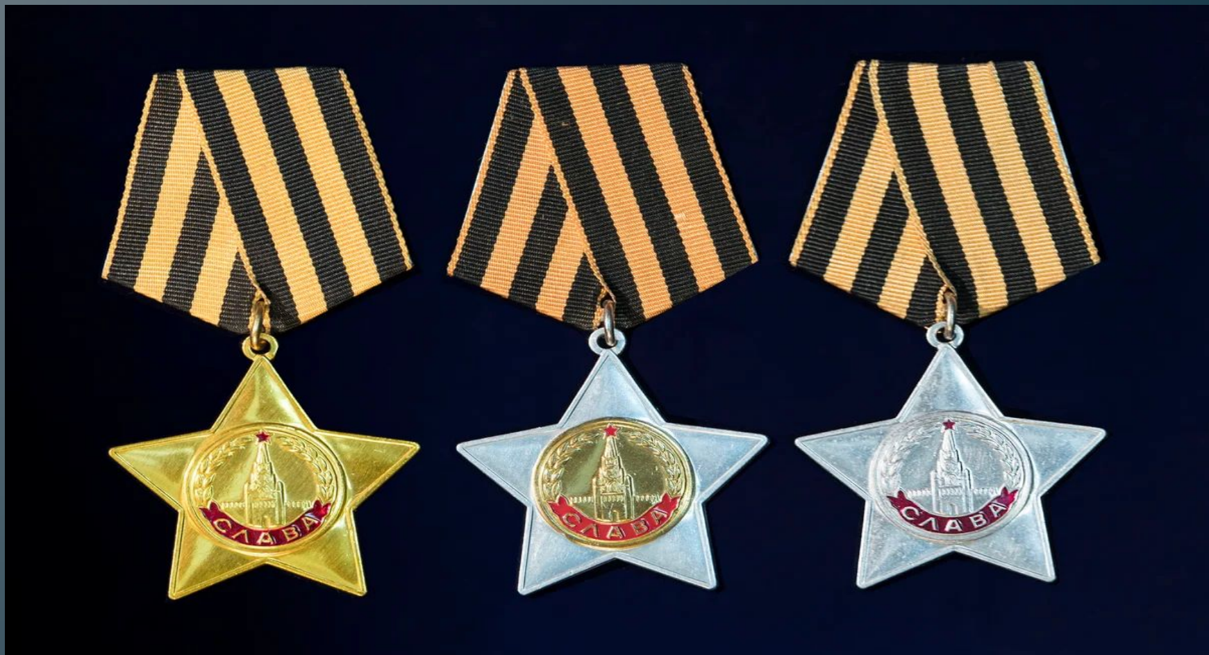
Ордена Славы 1-й, 2-й и 3-й степени