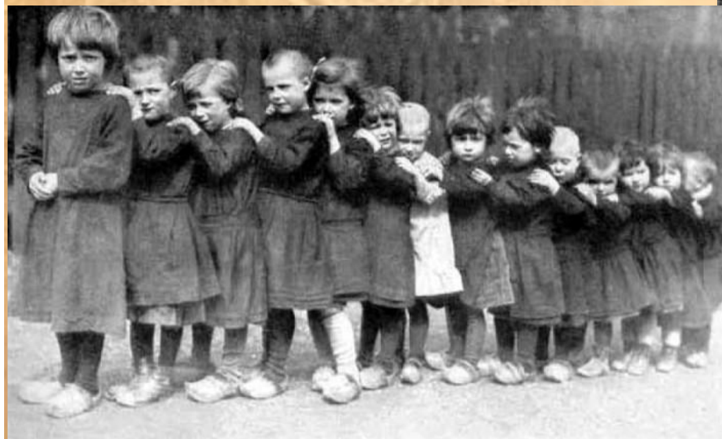
Детский концлагерь Красный Берег