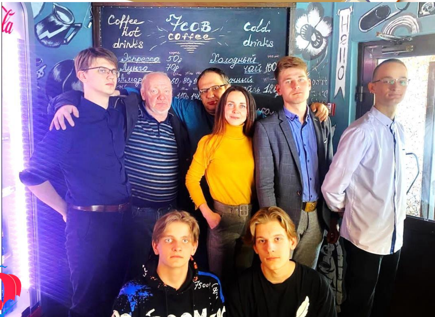
Городское любительское литературное объединение «Алые паруса» в полном составе