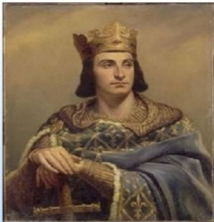
Филипп II Август – французский король