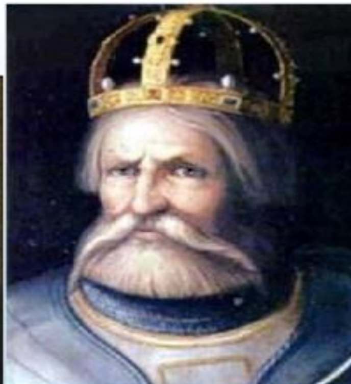
Фридрих I Барбаросса – немецкий король