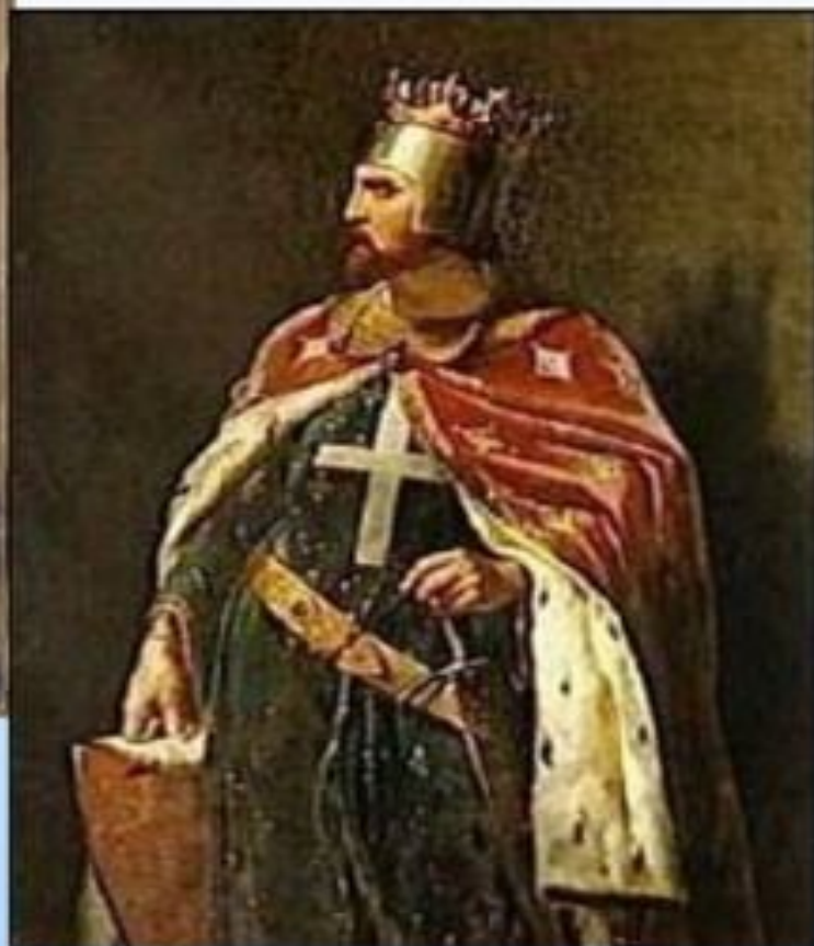
Ричард I Львиное Сердце – английский король