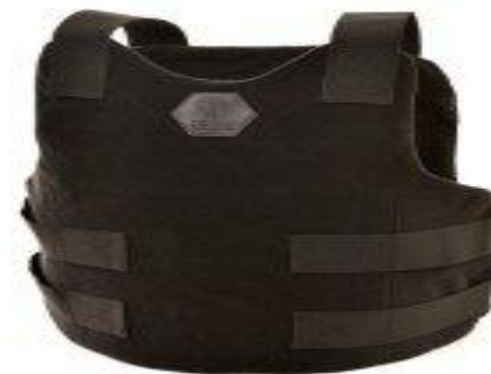
Бронежилет из кевлара Шилд 4-2 УНИ

Кевлár (англ. Kevlar ) — пара-арамидное волокно (полипарафенилен-терепфталамид), выпускаемое фирмой DuPont. Кевлар обладает высокой прочностью.