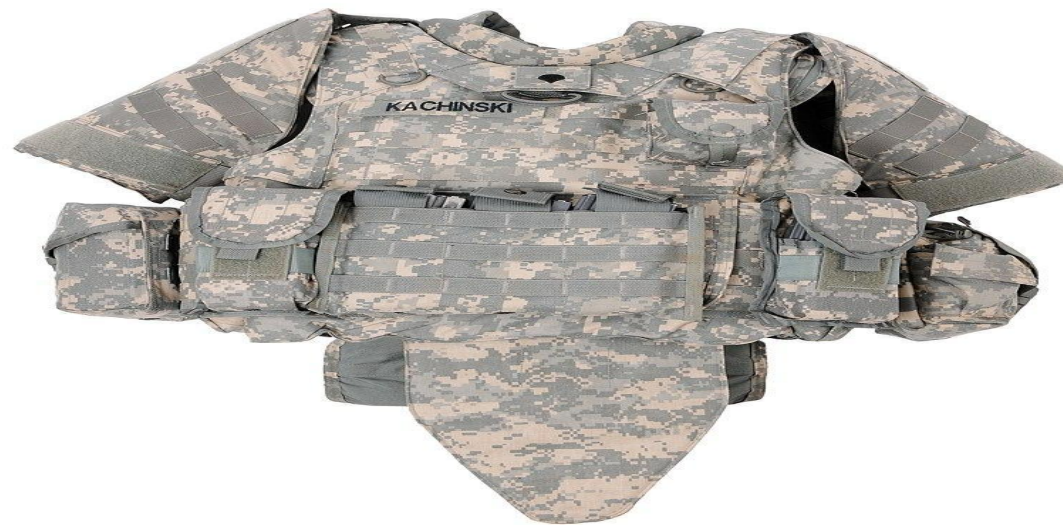
Бронезилет IOTV GEN II

Бронезилет — элемент индивидуальной защиты человека, обеспечивающий защиту верхней части туловища (торса) человека от воздействия огнестрельного оружия.