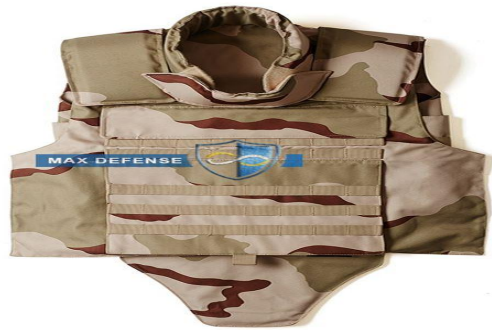
Китайский гибрид бронезилета из Арамида и Кевлара

Арамид - это сложное полимерное вещество. Название является аббревиатурой от термина "ароматический полиамид" в его английском написании.