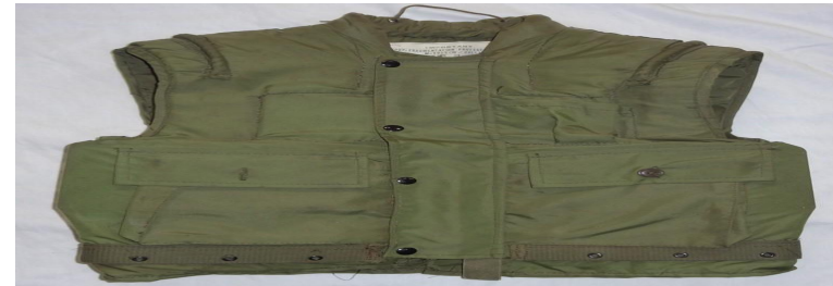
M1951 USMC Armored Vest

Первой бронежилетной тканью стал нейлон в особой, баллистической модификации. Один из первых бронежилетов, выполненных из нейлона, был выпущен в Штатах в 50-е годы и назывался M1951 USMC Armored Vest.