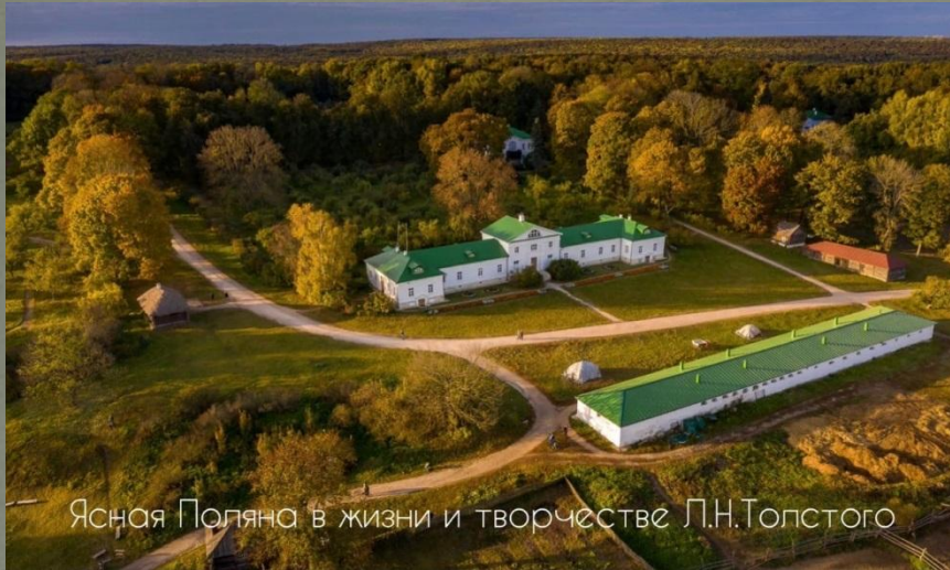
Ясная Поляна в жизни и творчестве Л.Н.Толстого