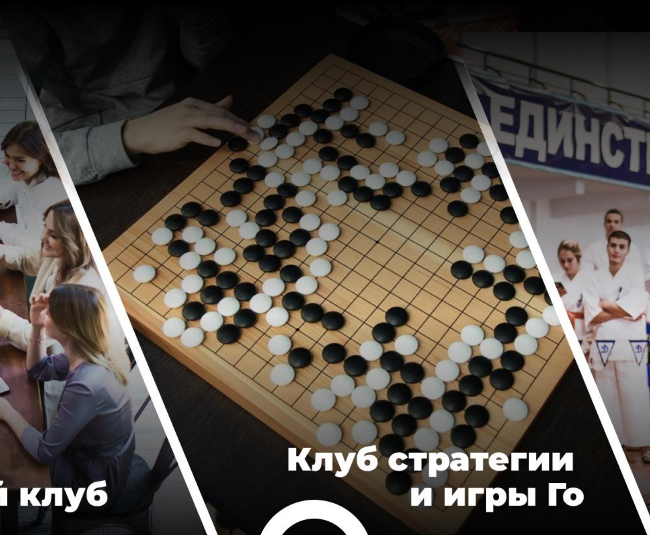
Клуб стратегии и игры Го