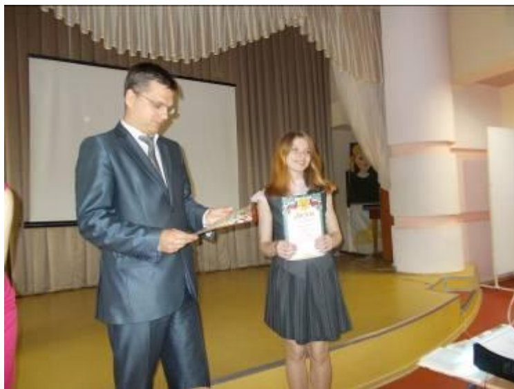
Вручение дипломов юным краоведам