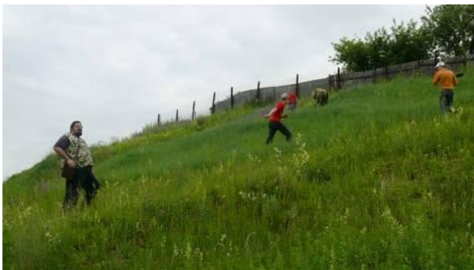
Обследование склонов городища Слобода

Во-вторых, школьники и учителя принимают активное участие в наших археологических исследованиях – как в летнее время в экспедициях, так и в течение учебного года