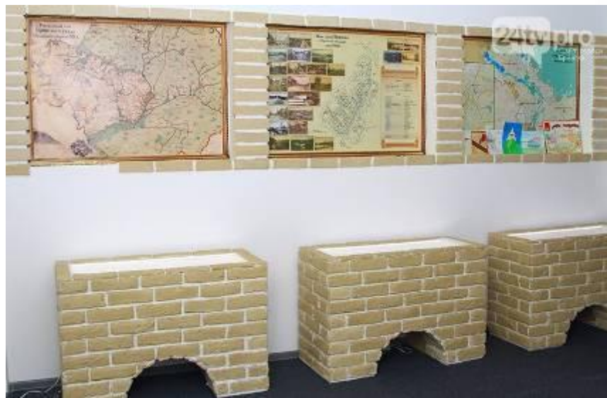
Музей в школе №59 г. Брянска