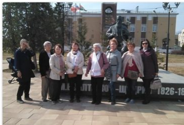
«Активное долголетие»: Экскурсия в Талдом