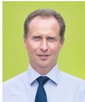
Кандидат физико-математических наук.

Можно даже утверждать, что потенциально, в данном муниципалитете, возможно осуществление «технократии» - власти специалистов и образованных людей. Но скорее всего, это связано со спецификой данного места, так как большая доля населения наукограда, задействованы в инновационной и научных сферах.