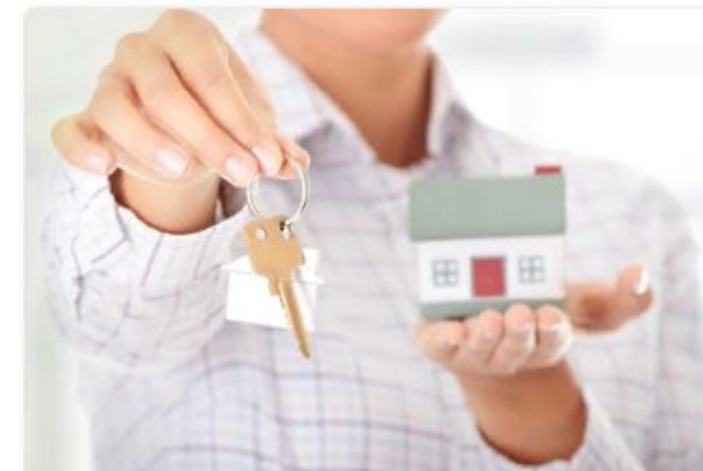
Приобретение жилых помещений для детей-сирот и детей, оставшихся без попечения родителей