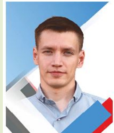
Кандидат физико-математических наук.