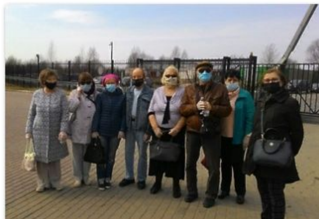
«Активное долголетие» на ЦКС «Дубна»