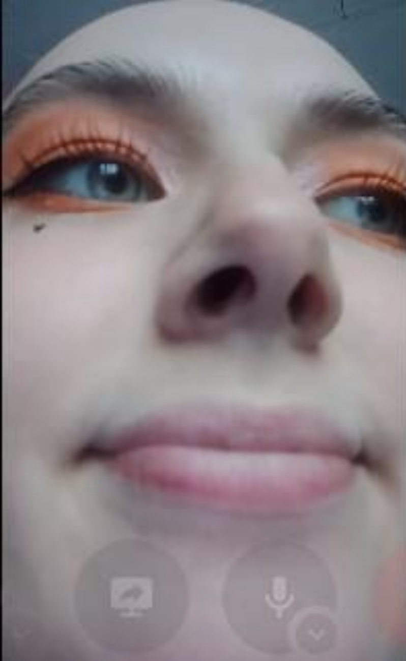
Самая лучшая девушка фото в цвете