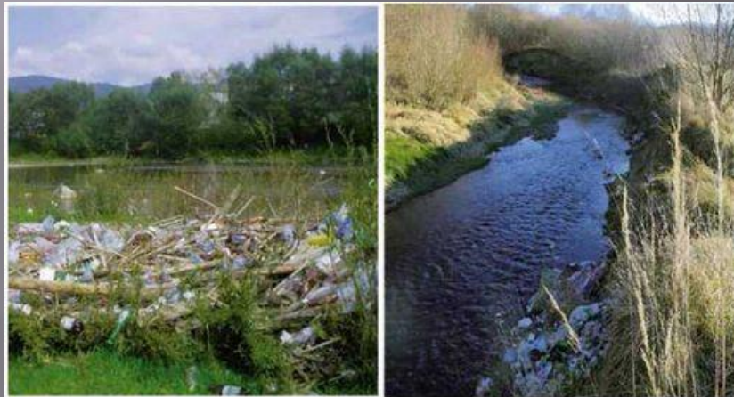
Мал. 174. Забруднення берегів великих і малих річок України внаслідок господарської діяльності людини

При цьому утворюються стічні води, які підлягають скиду в довколишні водні об'єкти.