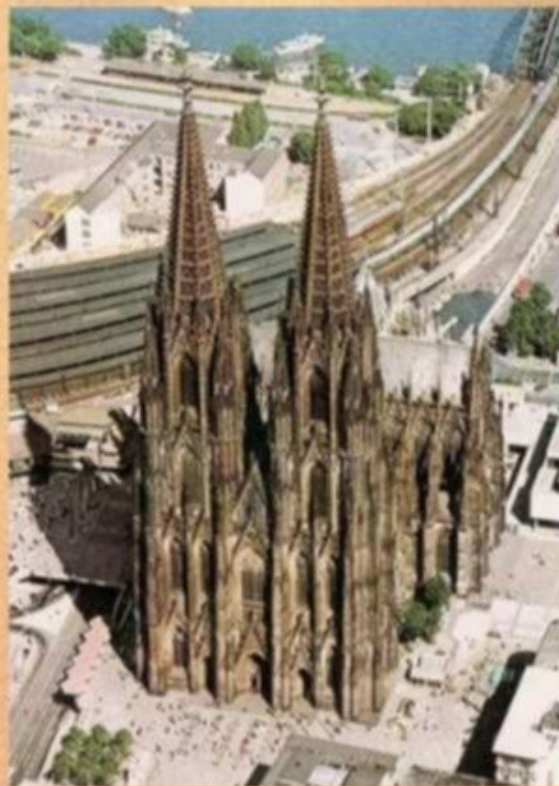
Кельнский собор. Германия 1248-1880 гг.