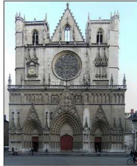
Кафедральний собор Івана Хрестителя в Ліоні