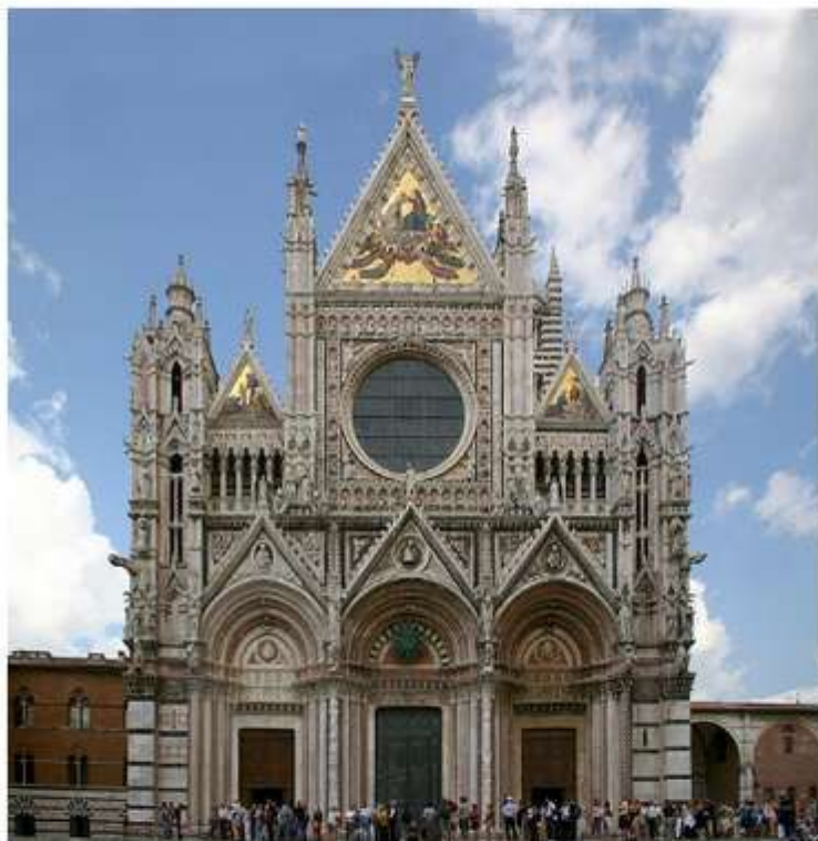
Сієнський собор. Західний фасад.