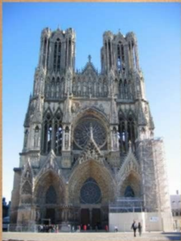
Собор в Реймсе. Франция 1211 – XV в.