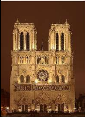
Собор Паризької Богоматері

Готика зародилася в Північній частині Франції (Іль-де-Франс) в середині XII ст. і досягла розквіту в першій половині XIII ст.