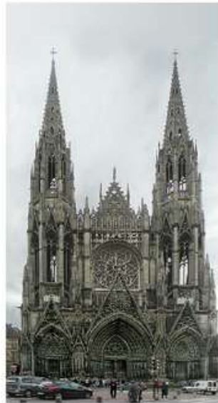
Церква Сен Уен, м. Руан