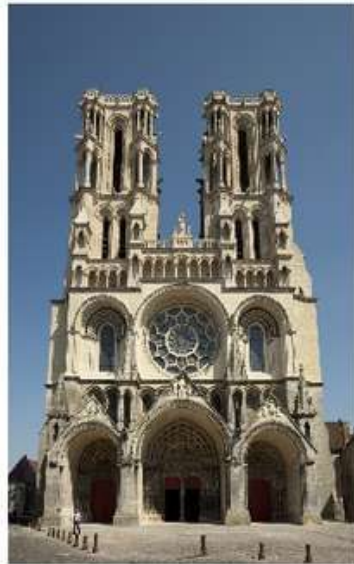
Катедральний собор міста Лан( Ланський собор)