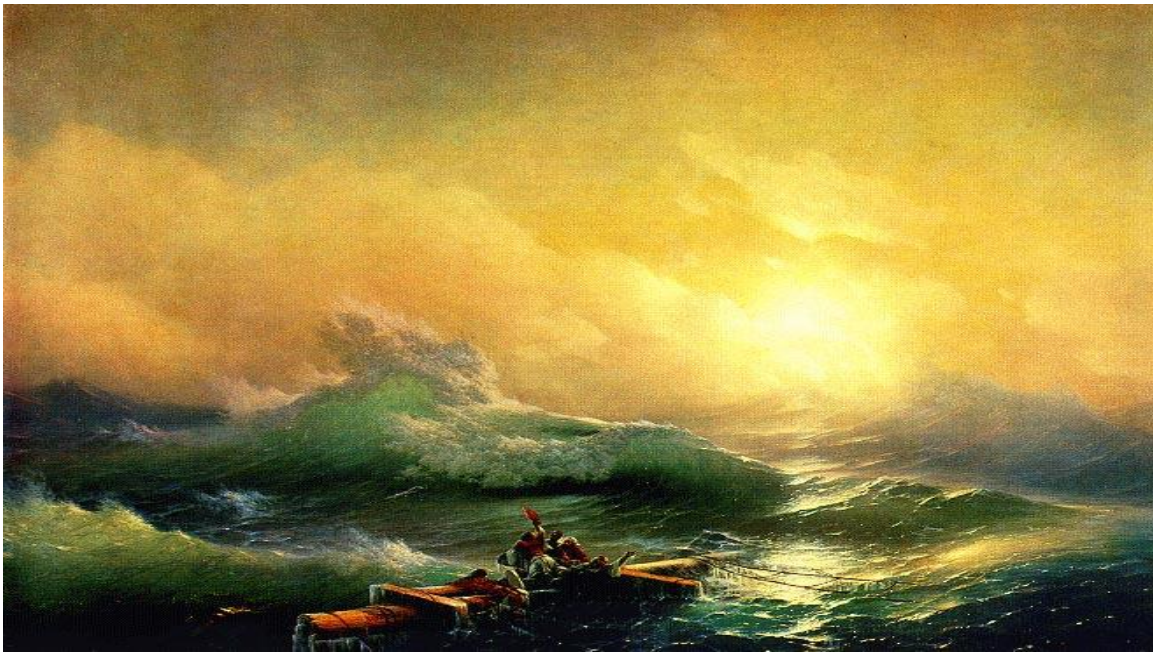
И. Айвазовский. Девятый вал.