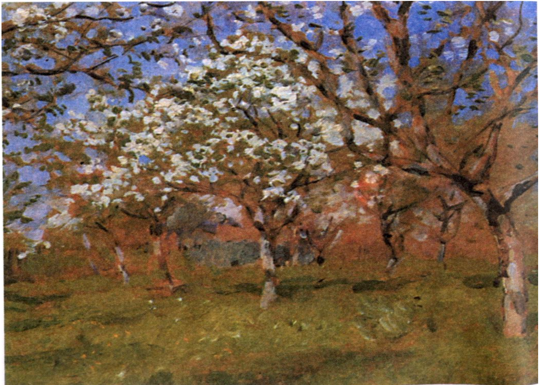
И. Левитан. Цветущие яблони (Фрагмент)