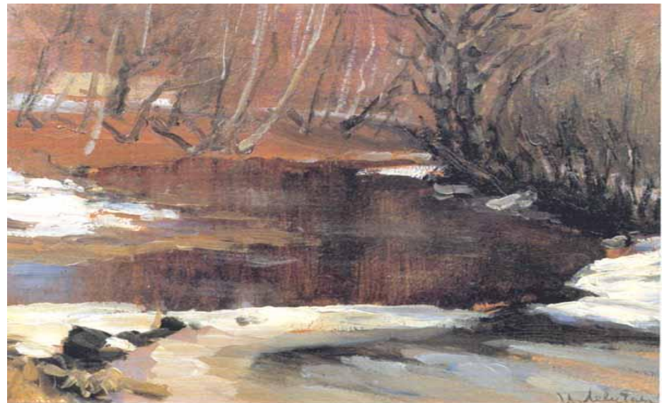
И. Левитан. Начало весны