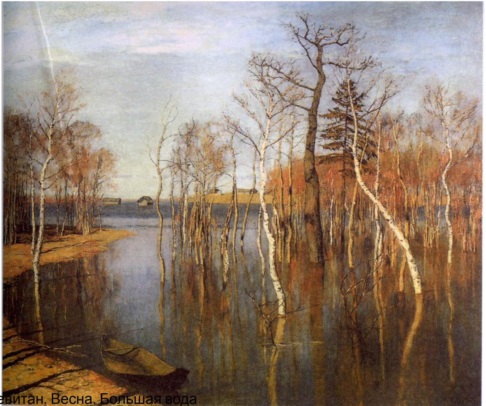
И. Левитан. Весна. Большая вода