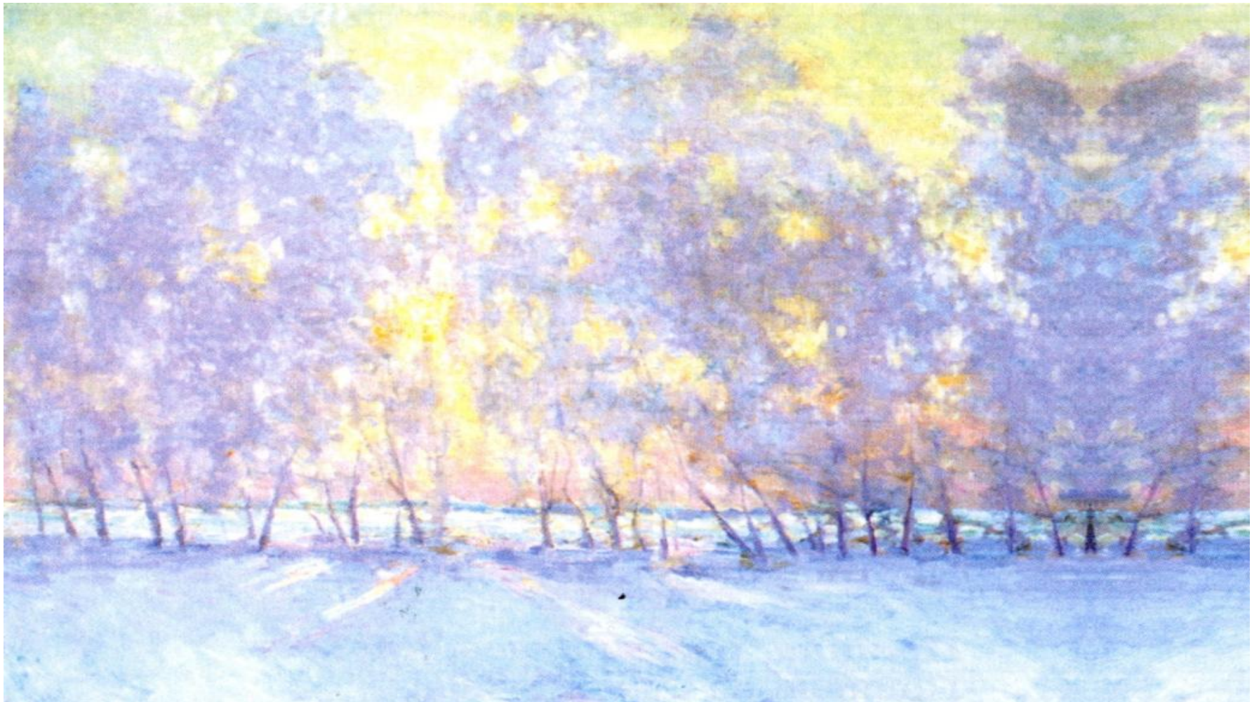
И. Грабарь. Иней. Восход солнца.