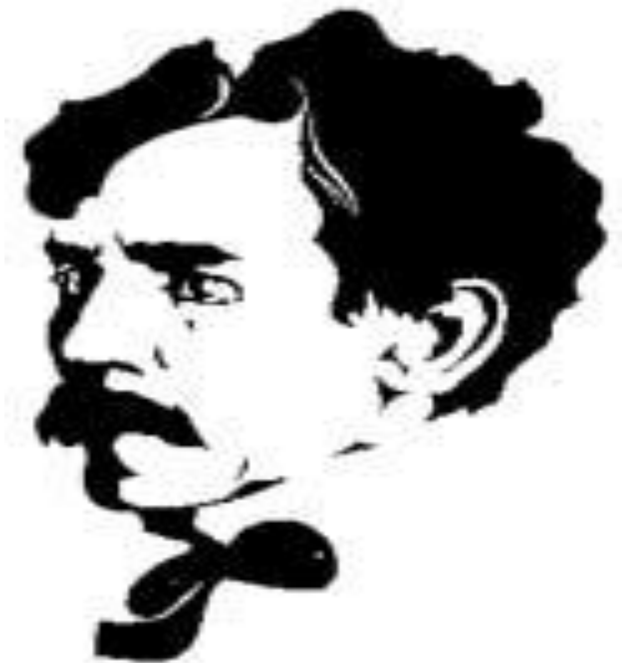
Микалоюс Константинос Чюрлёнис