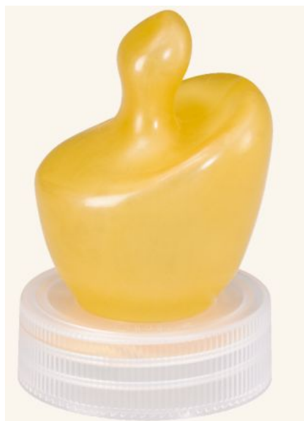
Соска для детей с расщелиной верхней губы

Благодаря широкому загубнику, хорошо закрывает дефект кожи и предотвращает заглатывание воздуха. Соска имеет отверстие, расположенное с небной стороны.