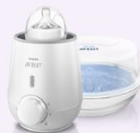
Подогреватели бутылочек и стерилизаторы