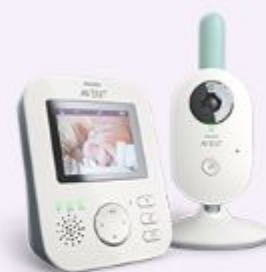
Радио- и видеоняни и термометры