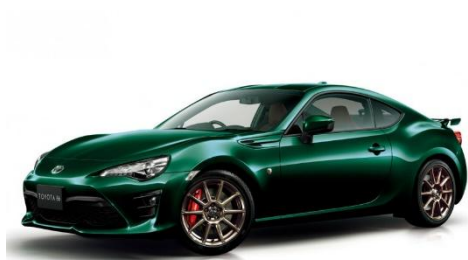
British racing green