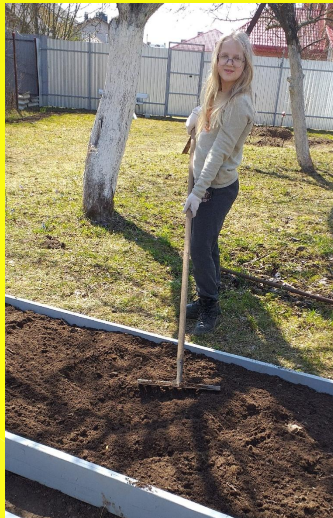
Сейчас я подготавливаю грядки к посадке