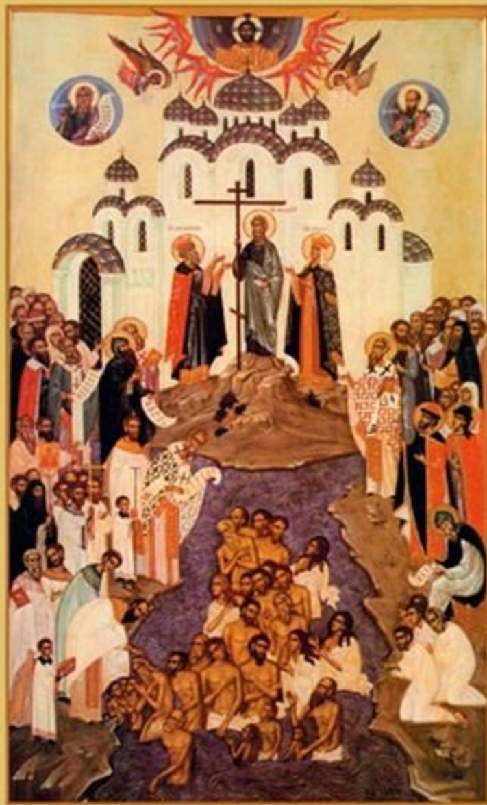
Так современный иконописец представил Крещение Руси.