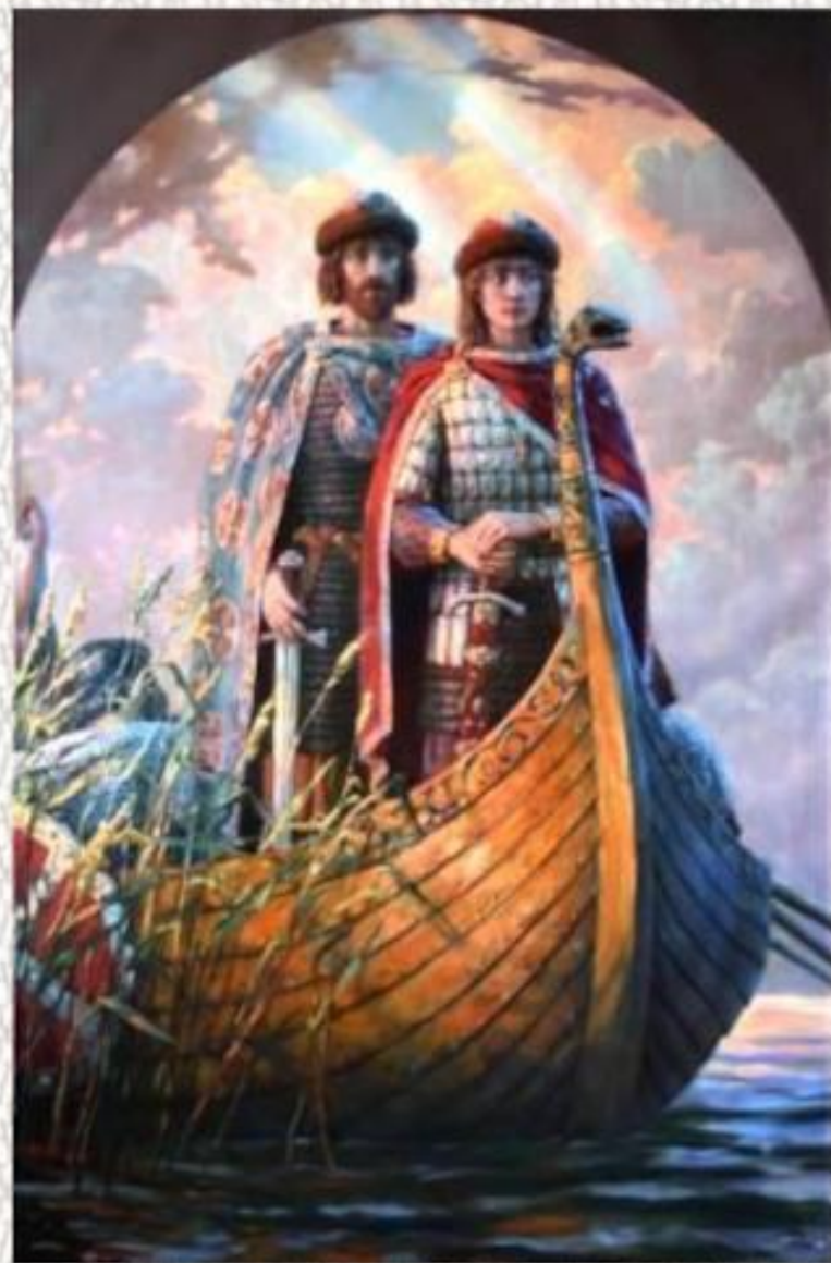
Святые великомученики Борис и Глеб. Демаков Е.А.

Русь приняла крещение, и жизнь русского человека стала устраиваться на новых, христианских началах. Летописец постоянно напоминает своему читателю заповеди Нового Завета. Древнерусский писатель предлагает чудное «Сказание о Борисе и Глебе» — братьях, которые, живя по новой вере, не захотели обратиться к прежнему обычаю мщения и братоубийства.