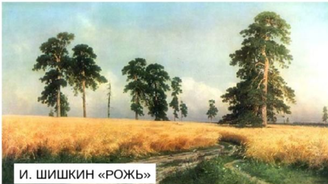
И. ШИШКИН «РОЖЬ»