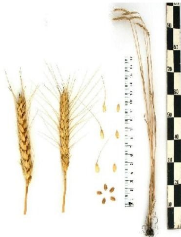
Озимая Мягкая пшеница КД Альянс