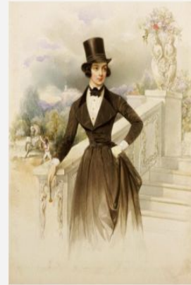
Михаил Лермонтов «К портрету»

Как мальчик кудрявый, резва, Нарядна, как бабочка летом. Значенья пустого слова В устах ее полны приветом.